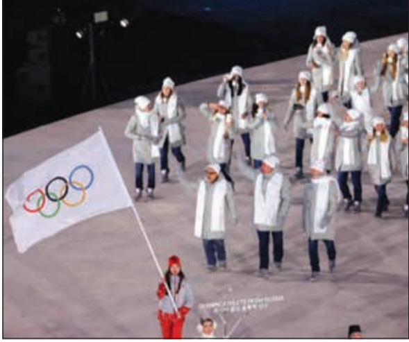
الوفد الروسي واجه أزمة الإيقاف لكثير من نجومه بسبب الاتهامات بتعاطي المنشطات