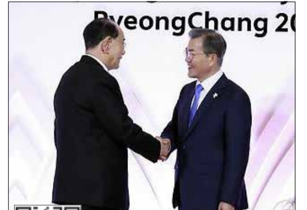
رئيس كوريا الجنوبية مون جاي إن يصافح الرئيس الفخري لكوريا الشمالية كيم يونغ نام قبيل حفل افتتاح دورة الألعاب الأولمبية الشتوية في بيونغ تشانغ