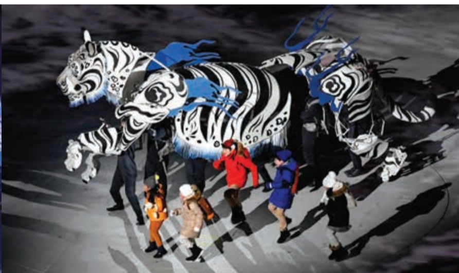
لوحات من التراث الكوري