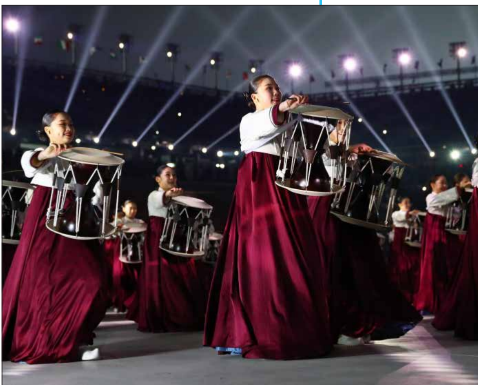
الطبول الكورية حاضرة

وأوضح أن وزارة الرياضة الروسية ستنتهي من إعداد جدول البطولة البديلة، وسيتم الإعلان عنها بالتنسيق مع الاتحادات الرياضية الأهلية. وأشار موتكو إلى أنه ستتم دعوة عدد من الرياضيين الأجانب، وستكون هناك جوائز مالية، مضيفاً أن الحدث ربما يقام في عدة مدن.