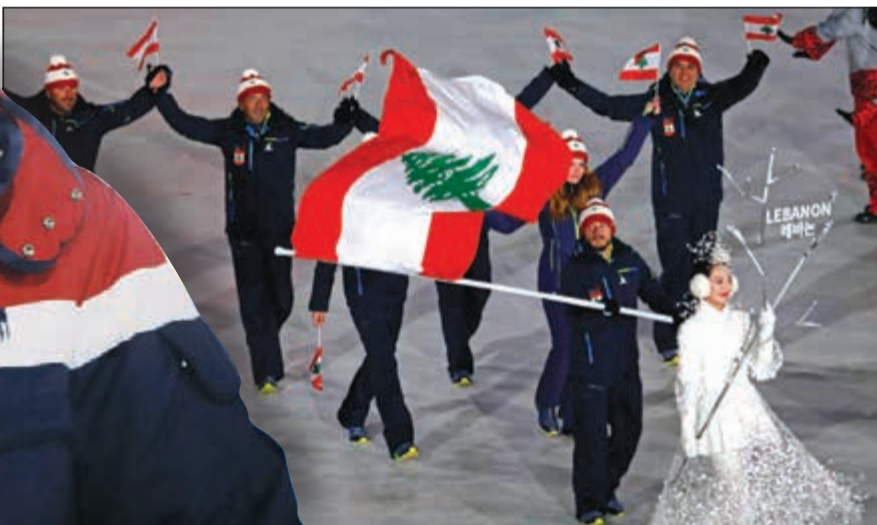
الوفد اللبناني أحد ممثلي العرب في الالبياد الشتوي