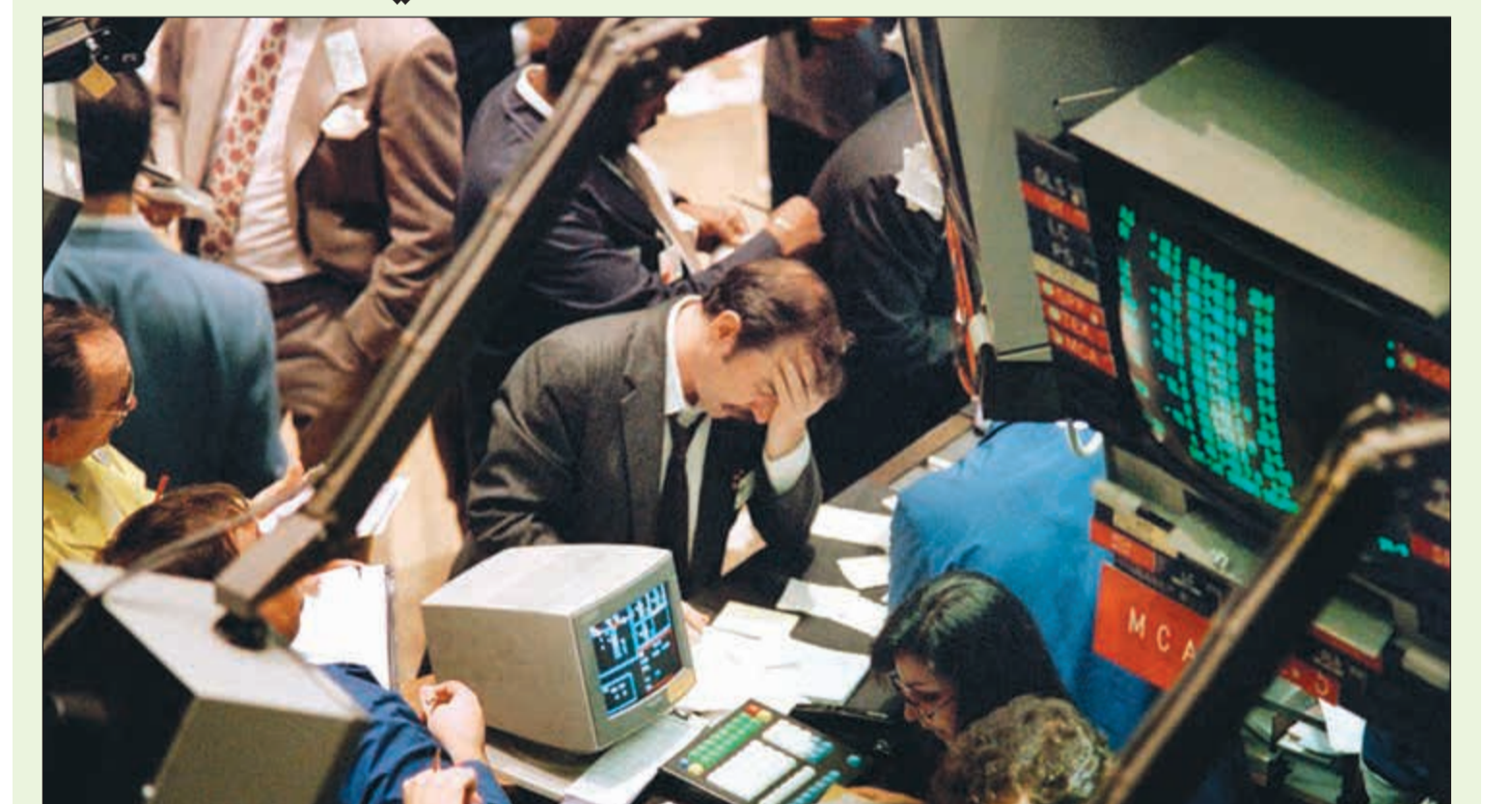
صورة قديمة للاثنين الأسود عام 1987

ارتفاع أسعار الفائدة لمستويات قوية، بحسب تقرير نشرته «الجارديان». وما إن تراجع التضخم، انخفضت تكاليف الاقتراض بشكل حاد وتعافى الاقتصاد، وهو ما ساعد رئيس البلاد «رونالد ريغان» في الفوز بولاية ثانية بنتائج ساحقة في الانتخابات التي جرت عام 1984. في الأساس، تولى «فولكر» هذه المهمة خلال عهد الرئيس الديمقراطي «جيمي كارتر»، لكن «ريجان» رأى أنه غير حريص على تنفيذ خطط تخفيف القواعد التنظيمية المالية لذا قرر استبداله بـ«ألان جرينسبان». وبعد ذلك بشهرين - في أكتوبر عام 1987 - كان انهيار السوق الأميركي (الاثنين الأسود).