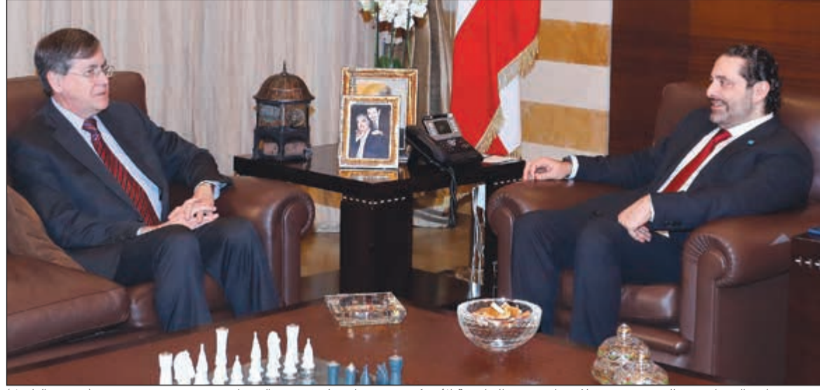
رئيس مجلس الوزراء سعد الحريري مستقبلا مساعد وزير الخارجية الأميركي ديفيد ساترفيلد في بيت الوسط

وحذر المجلس في البيان، من «الجدار الإسرائيلي في حال تشييده على حدودنا يعتبر اعتداء على سيادتنا، وخرق للقانون 1701». وأعلن المجلس الأعلى للدفاع «رفضه لتصرّجات (وزير الدفاع الإسرائيلي،