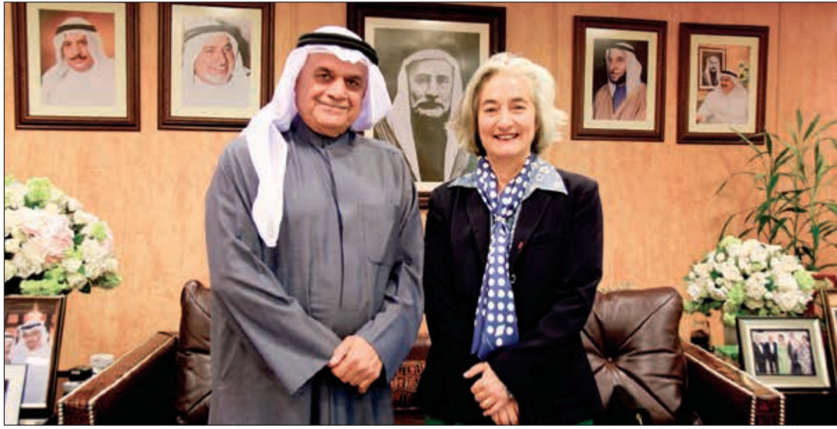
فيصل المطوع والسفيرة الفرنسية ماري ماس دوبوي خلال الزيارة

واحدة من أقدم وأكبر شركات التجزئة والتوزيع في سوق الاستهلاك الكويتي النامي، وإحدى أنجح شركات الكويت في قطاعي البيع بالجملة والبيع بالتجزئة، حيث تمثل أكثر من مئة علامة تجارية لخدمة مختلف شرائح المجتمع، وتسهل توفير هذه المنتجات في السوق المحلي.