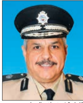
لواء الشيخ مازن الجراح

غير الحاصلين على تراخيص الإقامة أو من انتهت تراخيص إقاماتهم. وقال اللواء الجراح أنه تقرر الموافقة على تسوية أوضاع العمالة المنزلية المخالفة لقانون الإقامة بعد دفع الغرامات المترتبة على تركهم العمل بشرط وضع قيد إداري عليهم يمنع تحويل إقامتهم لمدة سنة واحدة تبدأ من تاريخ الموافقة على تسوية وضعهم.