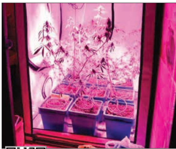
محصية قام المواطن بتدشينها لتوفير الأجواء المناسبة للنبات المخدر