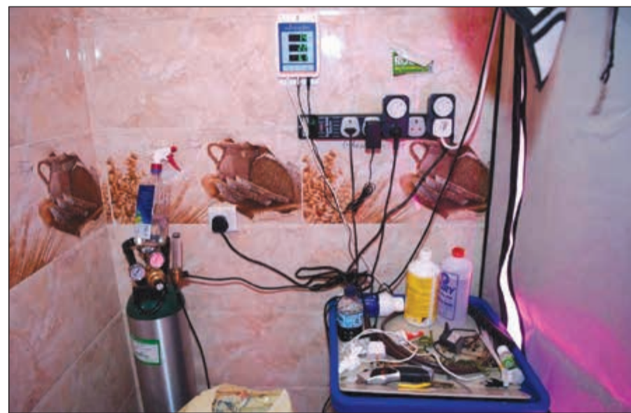
تجهيزات متكاملة أقامها المواطن في منزله لزراعة الماريغوانا