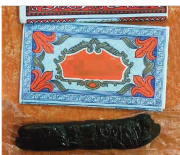
اصبع الخشيش ورق الف