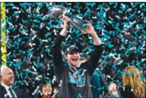
كابتن إيغلز كارسون وينتز يحمل الكأس

حقق فيلادلفيا إيغلز فوزا مفاجئا على نيو اينغلاند باتريوتس 33-41 في المباراة النهائية للسوبر بول، واحرز لقب بطل مسابقة كرة القدم الأمريكية. وكان باتريوتس مرشحا فوق لإحراز اللقب لكن إيغلز حقق إحدى أبرز المفاجآت في تاريخ رياضة كرة القدم الأمريكية. وتكرر سيناريو العام الماضي، حيث تخلف باتريوتس لفترة طويلة قبل أن ينجح في التقدم للمرة الأولى 33-32 قبل نهاية المباراة بتسع دقائق. لكن الكلمة الأخيرة كانت لإيغلز الذي توج باللقب للمرة الأولى منذ بداية السوبر بول عام 1967، علما أنه خسر النهائي مرتين عامي 1981 و2005.