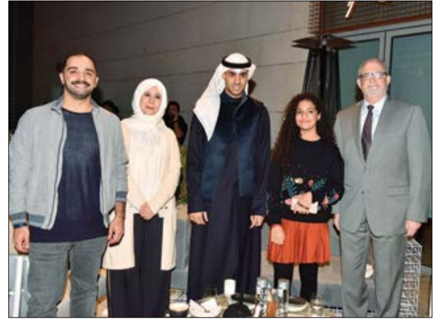
الرئيس التنفيذي لمجموعة زين بدر ناصر الخرافي والرئيس التنفيذي لشركة زين الكويت إيمان الروضان بتوسط السفير الأميركي لورانس سيلفرمان وحمد العلي «حمد قلم» (ريليش كوما)

300 طائرة «درون» أشعلت البهجة في قلوب رواد مركز جابر الثقافي