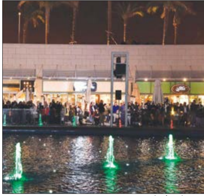
حضور جماهيري كبير لعرض «زين»