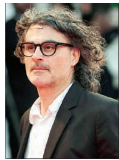
المخرج اللبناني زياد الدويري