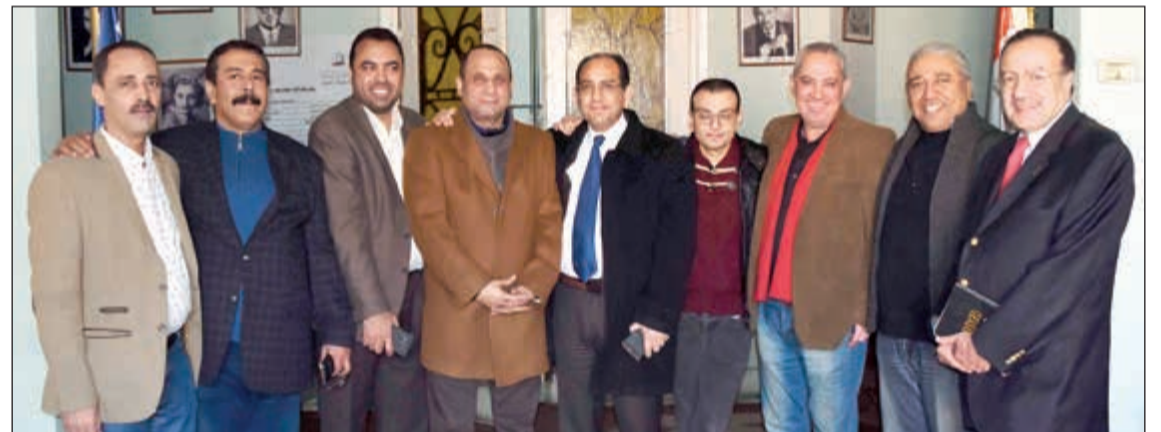
المشاركون في الاجتماع الأول للجنة بمقر نقابة السينمائيين بالقاهرة