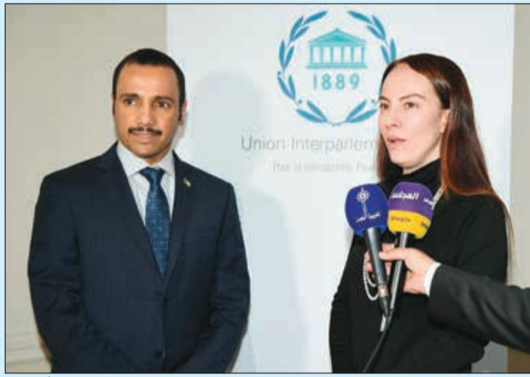
رئيس مجلس الأمة مرزوق الغانم مع رئيسة الاتحاد البرلماني الدولي غابرييلا كوفيفاس بارون في جنيف

والحماس الذي يظهره رئيس مجلس الأمة مرزوق الغانم مهم وقوي لتطوير وتنمية علاقات التعاون بين الكويت والمجتمع الدولي.