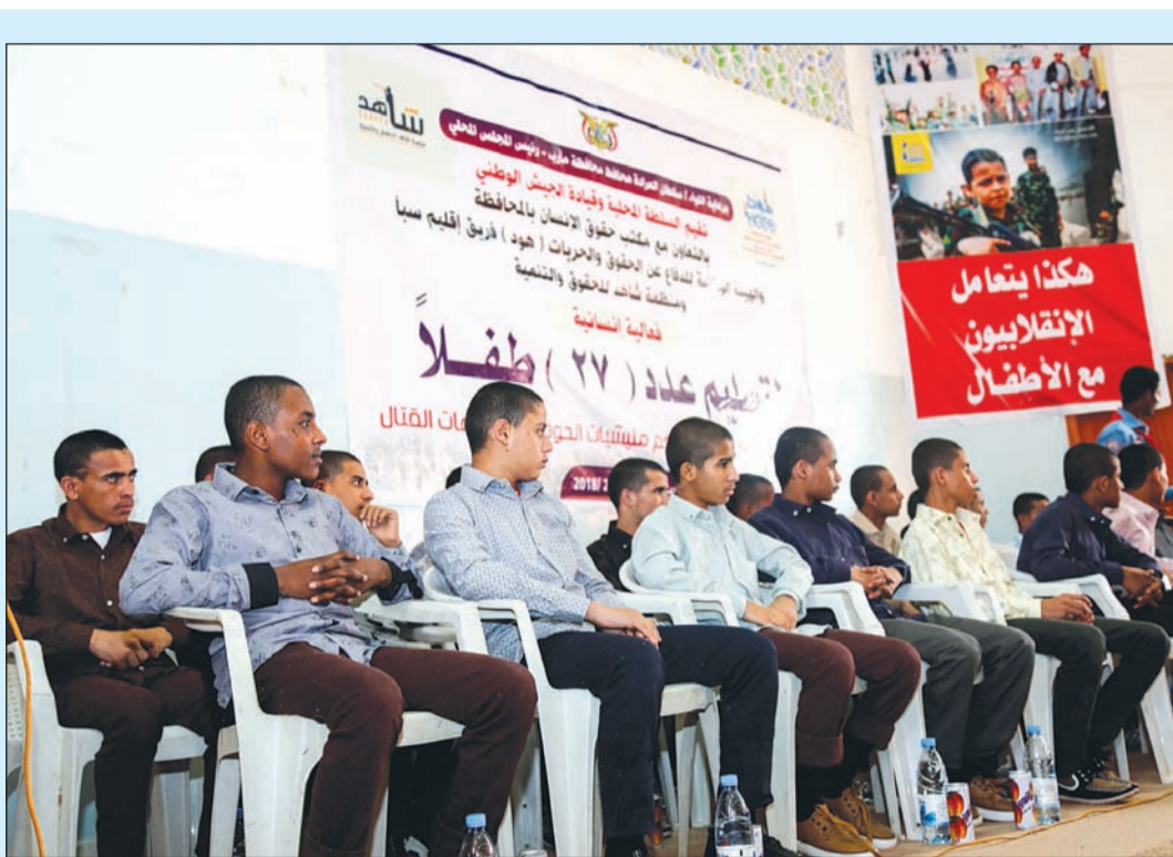
أطفال جندتهم ميليشيا الحوثي يحضرون فاعلية نظمها الحكومة الشرعية في مارب أمس الأول

بدأت إدارات شؤون الإقامة بالمحافظات الست في استقبال المخالفين لقانون الإقامة والمستفيدين من المهلة التي حددها قرار الشيخ خالد الجراح، وذلك لاستكمال إجراءاتهم إما بتعديل أوضاعهم أو مغادرتهم البلاد. وتستقبل جميع الإدارات المستفيدين من هذا القرار خلال الفترة الصباحية أثناء دوام العمل الرسمي، بالإضافة إلى استقبال إدارة شؤون إقامة الفروانية لهم خلال الفترة المسائية وعطلة نهاية الأسبوع (الجمعة والسبت) من الساعة 2 ظهراً حتى الساعة 7 مساءً وذلك تسهيلاً وتذليلاً للعقبات التي تواجه المراجعين. وحثت الإدارة العامة للإعلام الأمني والعلاقات جمع المخالفين على الاستفادة من هذا القرار وسرعة المراجعة لإنهاء إجراءاتهم.