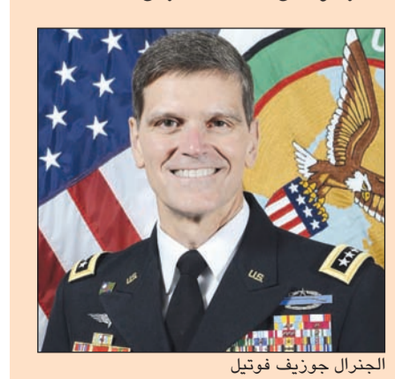
الجنرال جوزيف فويتل

الجنرال جوزيف فويتل: نقدر تضحيات شركائنا في مكافحة «داعش» ونشاط الدول الخليجية والعربية مخاوفها من أنشطة إيران بالمنطقة