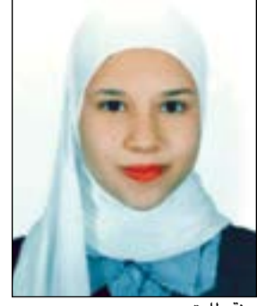
جنت طارق بدوي

كان هناك أب وأم وفتاتان توم بعيشون جميعا في أمان وسعادة، لكن خلافاً وقم بين الأبوين، فأخذت الأم ابنتها شمس فيما أخذ الأب ابنته قمر.. وتفرقت العائلة. عاشت شمس مع أمها وأخبرتها بأن أباها توفي مع أختها في حادث سير. أما الأب فقد أخبر ابنته قمر بأن أمها توفيت مع أختها خلال الولادة. وعندما بلغت الفتاتان الرابعة عشرة من العمر تقابلتا في حفلة مدرسية وتفاجتا بأنهما يشبهان بعضهما بعضاً. قالت لها شمس: لدي شقيقة توفيت مع أبي في حادث سير، فقالت لها قمر: وأنا أيضاً كان لي أخت توفيت مع أمي أثناء الولادة. واكتشفتا أنهما أختان من اسم الأم والأب، فغمهما فرح شديد وحضنا بعضهما طويلاً. فكرت الفتاتان أن تأخذ شمس مكان قمر وقمر مكان شمس. التقت شمس أباهما فقالت له: «أشعر أن أمي مازالت على قيد الحياة»، فأصعب