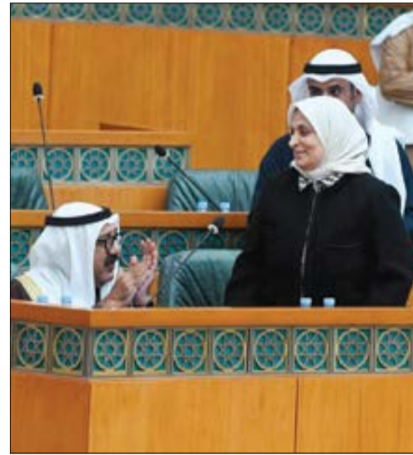
الشيخ ناصر صباح الاحمد محببا الصبيح