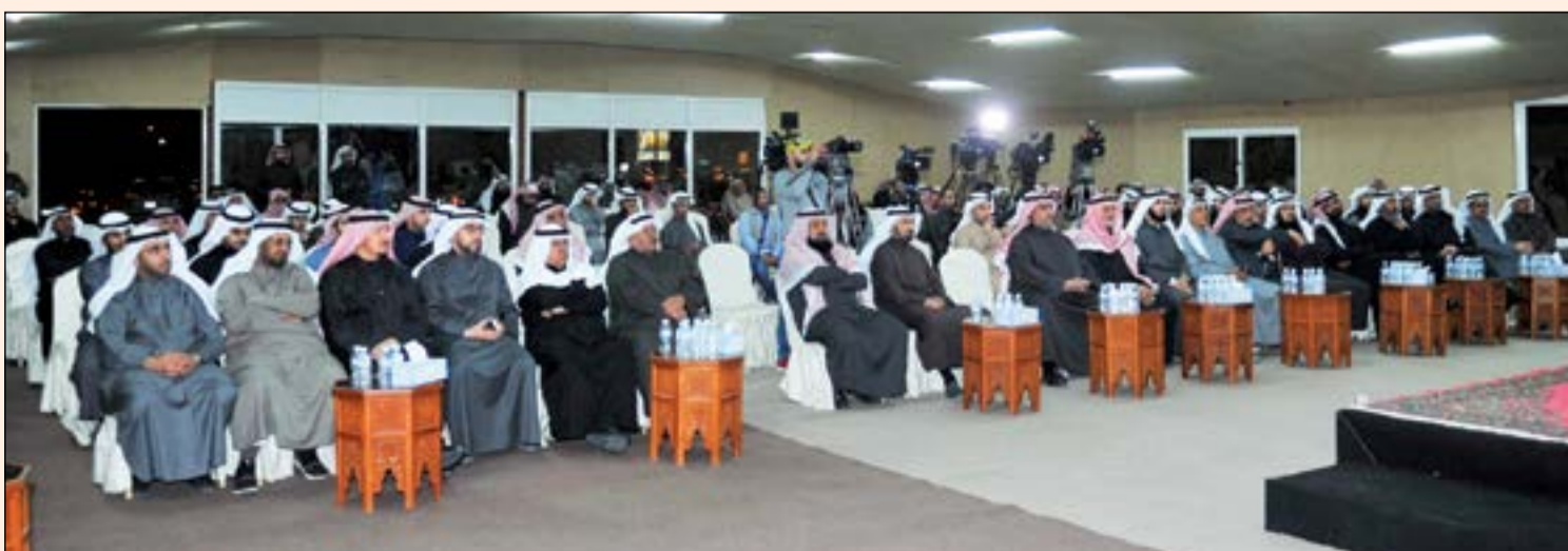
جانبا من الحضور في ديوان الخنة