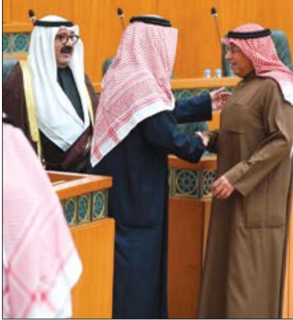
الشيخ ناصر صباح الأحمد والشيخ خالد الجراح وحمد الهرشاني

سائلاً سموه المولى تعالى أن يوفق الجميع ويسدد الخطى لخدمة الوطن العزيز ورفع رايته.