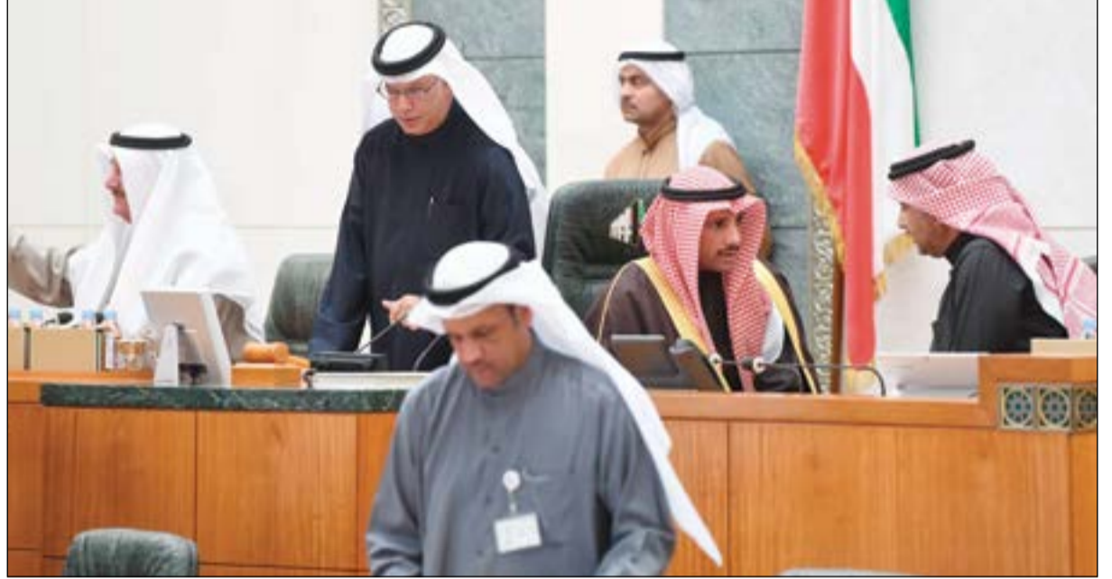
رئيس مجلس الأمة مرزوق الغانم ونائبه عيسى الكندري وأمين السر د.عودة الرويعي ومبارك الحريص على المنصة (ماني الشمري)

تقول الوزيرة قدمت لكم معلومات غير دقيقة. حسبي الله على كل واحد ينصر ظالماً واللقاء ليس في الانتخابات بل عند رب العالمين.