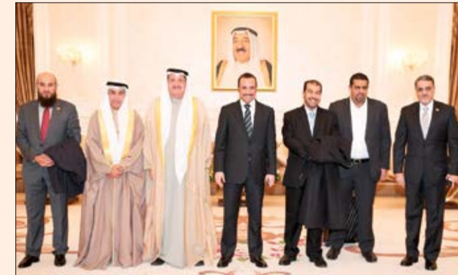
الرئيس مرزوق الغانم ونائبه عيسى الكندري وم.عادل الخرافي ود.خليل عبدالله وركان النصف وعلي الديباسي وعلام الكندري

ويضم الوفد البرلماني المرافق للغانم كلا من وكيل الشعبة البرلمانية الناشب ركان النصف وعضوي الشعبة البرلمانية النائبين علي عبدالله الديباسي ود.خليل عبدالله والأمين العام لمجلس الأمة علام الكندري.