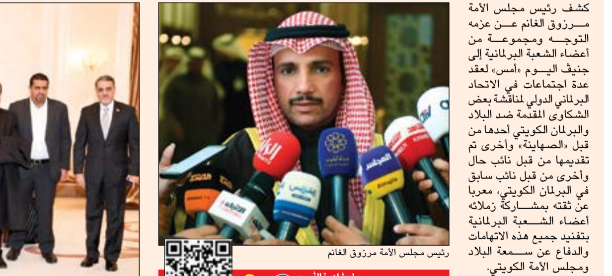
رئيس مجلس الأمة مرزوق الغانم

«جنيث» لعقد عدة اجتماعات مع الاتحاد البرلماني الدولي ولقاء الأمين العام له ورئيسته لعدة أسباب يأتي في مقدمتها الدفاع عن سمعة الكويت والبرلمان