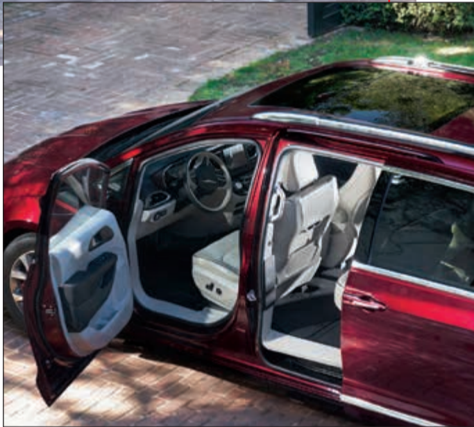
تصميم عملي عالي الجودة