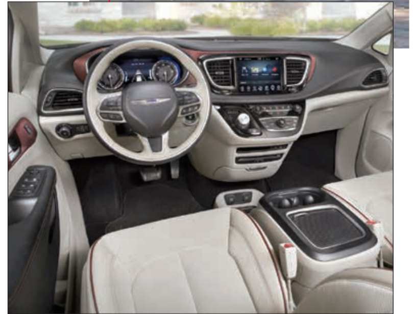
داخلية أنيقة ومتطورة

وتتوافر شاشة يوكونيكت متطورة تعمل باللمس إما بقياس 5 بوصات (127 ملم) أو 8,4 بوصات (213 ملم)، كما يتم ضبطها مع لوحة القياس للحصول على مظهر فني