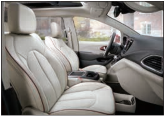
مساحة داخلية كبيرة تلبي الاحتياجات كافة