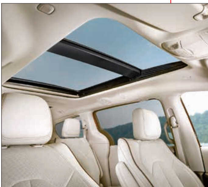
فتحة سقف بانورامية

نظيف. ومع سطح شاشة لامعة تسمح بتباين عالٍ، يتم الشعور بشاشة تعمل باللمس مستقبلية وتتمشى مع الأجهزة الحديثة الأخرى، مثل التابلت. وفي ضوء النهار، تبدو المقصورة في غاية الجمال والروعة، مع لوحة أجهزة قياس أنيقة، وسطح سائل في وسطها. وعلى صعيد طرازات ذات مستويات أعلى، تضيف لوحة أجهزة بحواف مخبطة لمسمة من الزخرفة الرائعة. وأثناء الليل، تثير المقصورة عواطف مختلفة مع طلة تقنية أعلى، مع إضاءة بيضاء على الأزرار وتوهج الشاشة العنقودية بكلمة «كرايسلر» باللون الأزرق. كما تستخدم عناصر التحكم الأخرى أيضاً الإضاءة الزرقاء، مقابل الإضاءة البرتقالية المستخدمة تقليدياً، وذلك لتحقيق طلة أكثر أناقة وتطوراً.