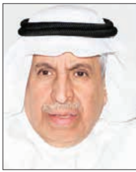
د. عبدالعزیز الفايز

أعرب سفير خادم الحرمين الشريفين لدى الكويت د. عبدالعزیز الفايز عن تهنئته الكويت بمرور 57 عاماً على الاستقلال و27 عاماً على ملحمة التحرير والكويتي الذي أصبح دولة لها مكانتها المرموقة إقليمياً ودولياً. وأشار إلى أن ذكرى يوم التحرير المجيد «تذكرنا بالتضحيات الكبيرة التي قدمها شعب الكويت الأبي وشهدائه الأبرار خلال فترة الغزو المبررة ومثل ذلك اليوم بداية مرحلة جديدة في تاريخ الكويت المعاصر خرجت فيها من محنة العدوان والاحتلال واستطاعت خلال فترة قصيرة أن تتعافى من آثاره وتتجاوزها». وأوضح أن الكويت