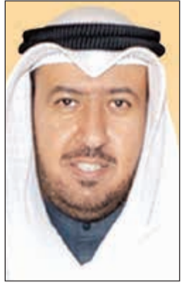
د. فهد العفاسي

قال وزير العدل ووزير الأوقاف والشؤون الإسلامية د. فهد العفاسي إن صاحب السمو الأمير الشيخ صباح الأحمد نجح بوحدة الوطنية للشعب الكويتي. وأضاف العفاسي لـ (كونا) أمس الأول الأثنين بمناسبة الذكرى الـ 12 لتولي صاحب السمو الأمير مقلد الحكم أن الجميع يشهد لسموه بالمكانة الكبيرة التي يحظى بها بين زعماء العالم بسبب مواقفه الثابتة والراسخة إزاء المستضعفين ودعم سموه لجهود السلام والأمن في العالم والحيلولة دون تفاقم الأزمات. وأكد أن الكويت شهدت في عهد سموه خلال الـ 12 عاماً الماضية نهضة عمرانية كبيرة على كل الصعد جعلت من الكويت دولة قوية رغم صغر حجمها وعظم مواقفها الثابتة تجاه القضايا الإسلامية والدولية. ومن دور سموه محلياً وخارجياً وفي مشاريع التنمية والفكرة التشريعية في البلاد إلى جانب النأي بالكويت عن الفتن والفوضى العارمة التي اجتاحت المنطقة. وبين أن مواقف سموه الإنسانية جعلت من الكويت مركزاً للعمل الإنساني ومحط إعجاب العالم لإسيما خلال سعي سموه للمحافظة على تماسك البيت الخليجي. وتبنى العفاسي أن يتبعه الله على سموه بوافر الصحة والعافية وأن يوفق سموه لما فيه خير الكويت وشعبها وأن يعم الأمن والأمان الكويت تحت ظل قيادته الحكيمة داعياً الله عز وجل أن يحفظ الكويت من شر الفتن ما ظهر منها وما بطن.