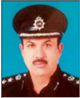
العميد توحيد الكندري

حيث ضبط 517 مطلوباً جنائياً ومدنساً ومتغيباً بالإضافة إلى 1102 مخالفاً لقانون الإقامة وبدون إثبات،