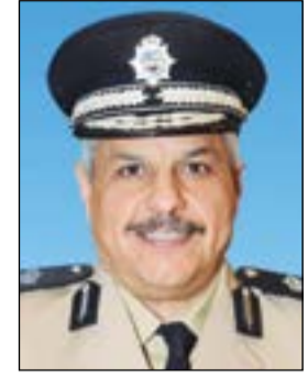
اللواء الشيخ مازن الجراح

وزارة الداخلية - إلى توفير الوقت والجهد على المراجعين مع تقديم خدمة أفضل، بالإضافة إلى تسهيلات خاصة لذوي الاحتياجات الخاصة وكبار السن والمرضى. يذكر أن خدمة حجز المواعيد المسبقة على موقع