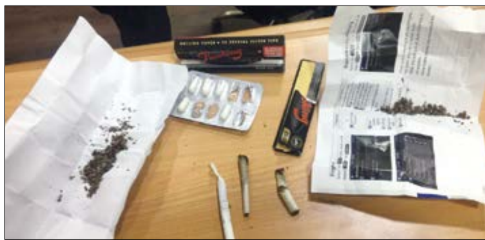
المواد المخدرة المضبوطة

أحال قطاع الأمن العام إلى الإدارة العامة لمكافحة المخدرات 8 أشخاص ضبطوا في مناطق متفرقة وبحوزتهم مواد مخدرة وأدوات تعاط. وبحسب مصدر أمني فإن مواطنين ضبطوا في عبدالله السالم وكانا نائمين في مركبة، أما الثالث فمضبط في الصالحية حيث ضبط خلال قيادته للمركبة وهو بحالة غير طبيعية، أما في مبارك الكبير فمضبط 3 أشخاص بواقع شخصين كانا في مركبة والثالث في أخرى وذلك خلال حملة تفتيش وعثر معهم على أكياس بها مواد مخدرة، أما المتعاطي السابع فمضبط على الدائري السادس وكان نائماً داخل مركبة وضبط معه كيسان بهما مادة عشبية، والثامن سقط في قبضة سريه المهام الخاصة وبحوزته كيس كيميكا.