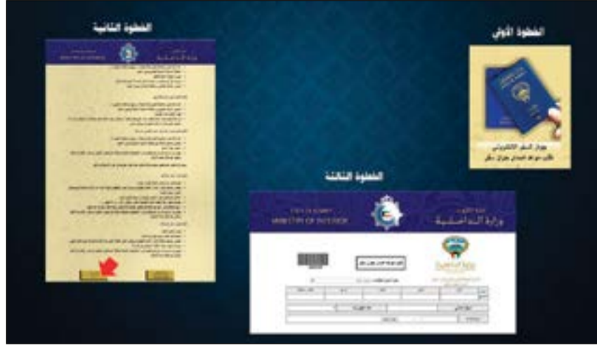
موقع خدمة حجز الموعد المسبق

وزارة الداخلية مزوده بخدمة خاصة للمرضى وذوي الاحتياجات الخاصة، حيث يمكن لذوي الحالات المرضية والخاصة بطلب تحديد موعد لحضور أحد موظفي مراكز خدمة الإدارة العامة للجنسية وفنادق السفر إلى منزله