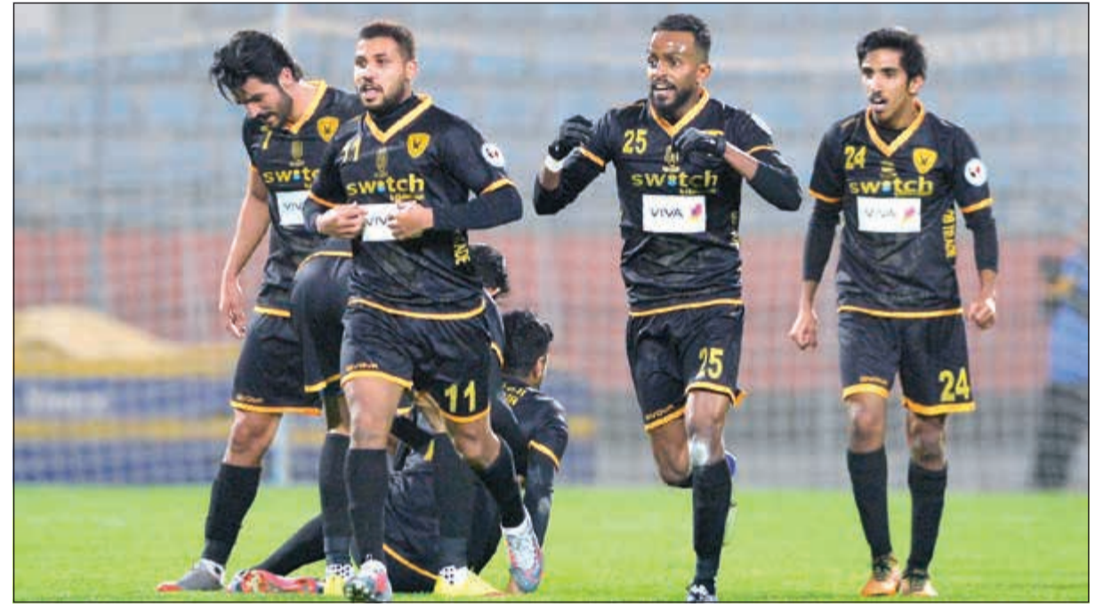
القاسية يعلق تدريباته قبل النهائي المرتقب

وأضاف: لدينا ثقة كبيرة بلاعبينا الذين متى ما كانوا في مستوياتهم المجهودة فإن الفوز سيكون حليفهم وهذا من واقع خبرة طويلة مع اللاعبين، لافتا إلى أن الجهاز الفني للأبيض يمتلك عددا من الحلول للتعامل مع المباراة ويتوافر عدد كبير من اللاعبين المميزين وبجاهزية بدنية وفنية عالية فضلا عن دعم مجلس إدارة النادي للفريق.