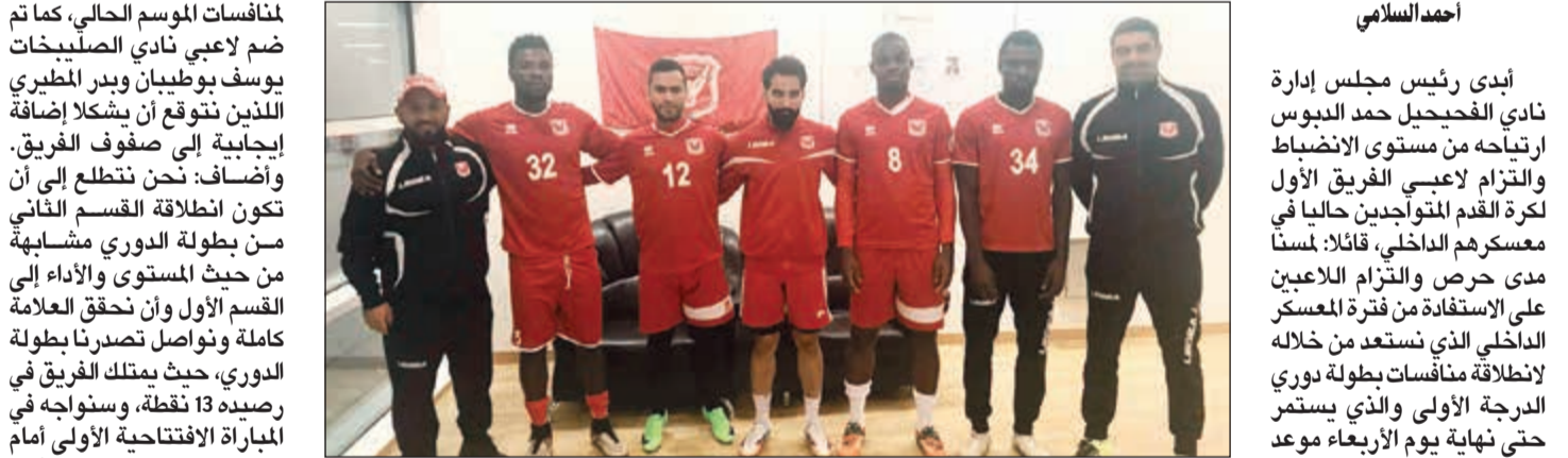
الفحيحيل أنهى تعاقداته مع المحترفين والمحليين