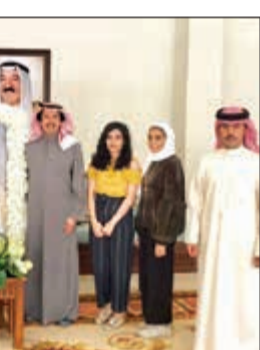
الشيخ عزام الصباح متسلما صورة سمو الأمير من الكندري ووفد الطلبة

في مكانة دولية مرموقة. وأشار إلى أن صاحب السمو يواصل عاما بعد عام مسيرة الخير والسلام والوفاق على كل المستويات بإياديه البيضاء ومبادراته السامية ساعيا باستمرار لتحقيق التقارب ولم شمل الأصدقاء، وهو مزار إعجاب وتقدير العالم أجمع. وقال الشيخ عزام إننا نرفع في هذه المناسبة أسمى التهاني لمجددين البيعة للقائد الإنسانية بأن نعمل دائما وأبدا في خطاه من أجل خدمة الكويت وشعبها ورفعته شأنها. وأهدى الوفاء الطلابي الشيخ عزام صورة عملاقة لصاحب السمو الأمير بمناسبة ذكرى تولي سموه مقاليد الحكم.