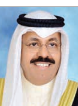
الشيخ أحمد النواف

الخير والسلام والوفاق على كل المستويات حافظا أمانة الكويت ودستورها ومعززا دورها في تحقيق التقارب ولم الشمل بين الأصدقاء في ظل ما تشهده المنطقة والعالم من توترات لما لذلك من أهمية في تمتين وحدة الدول العربية وبالأخص دول مجلس التعاون الخليجي وضمان مستقبل أفضل لشعوبها. وتنمى لصاحب السمو الأمير موقور الصحة والعافية لبتابع سموه مسيرته المشرفة والحافلة بالعطاءات والإنجازات والمزيد من التقدم والازدهار وأن تكون واحة أمن وأمان.