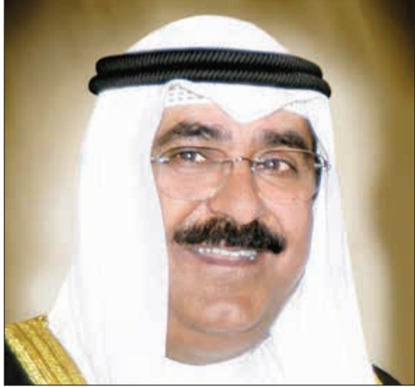
الشيخ مشعل الأحمد

تواجدا قويا ومؤثرا ومكانة عالية في العالم وقد توج هذه المكانة بالتكريم الدولي الكبير بمنحه لقب قائد العمل الإنساني وإعلان الكويت مركزا للعمل الإنساني من قبل الأمم المتحدة في سابقة فريدة تعكس تقدير واحترام العالم لقائد كبير وزعيم بارز صاحب مواقف مشرفة. وأكد أن سموه عندما تسلم مقاليد الحكم عام 2006 حرص على استكمال ما بدأه أسلافه من حكام الكويت عبر مسيرة من العمل والعطاء وقاد مرحلة جديدة في تاريخ الكويت من أجل تحقيق حلم الأبناء والأجداد ببناء دولة عصرية حديثة تقوم على العلم والتكنولوجيا.