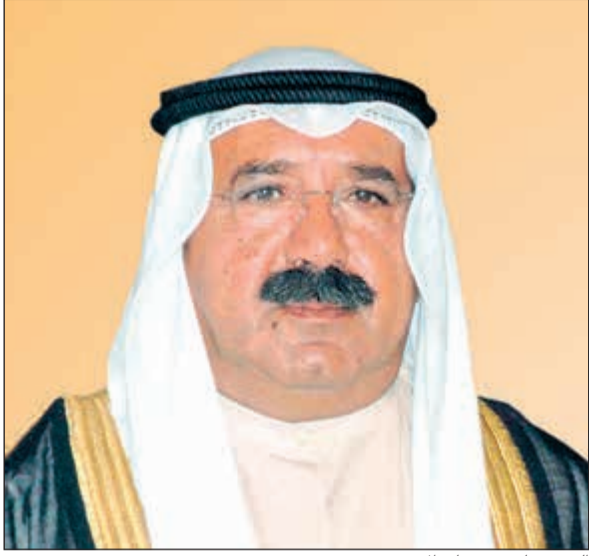
الشيخ ناصر صباح الأحمد

في بذل الجهود لتحقيق رؤية سموه حفظه الله 2035 التي ستكون عنوانا بارزا للمستقبل الزاهر لأبنائنا من الشعب الكويتي والأجيال القادمة للانطلاق نحو نقلة استراتيجية تيسر بنهضة تنمية غير مسبوقه في عهد سموه تقي بالخير والرفاه للكويت وشعبها.