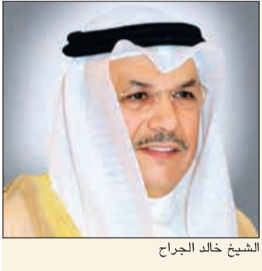
الشيخ خالد الجراح

أكد النائب الأول لرئيس مجلس الوزراء وزير الدفاع الشيخ ناصر صباح الأحمد أن تاريخ الكويت سيخلد بكل فخر واعتزاز المسيرة المباركة لحضرة صاحب السمو الأمير الشيخ صباح الأحمد وجهوده المتواصلة للحفاظ على استقرار الكويت وتحقيق الخير والأزدهار لأبنائها.