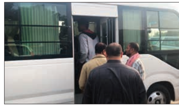
عدد من المخالفين إلى باس الحملة

وأُسفرت عن ضبط العمالة المتجولة والمخالفة وفقا للمادة 136 من قانون العمل رقم 2010/6 والتي تمنح المفتشين الحق في تحرير مخالفة لغير مركز عمل محدد، مشيرا إلى استمرار الحملات التفتيشية التي تشنها اللجنة على مختلف المناطق في الكويت، بهدف معالجة مواطن الخلل في سوق العمل، مناشدا العمالة وأصحاب العمل ضرورة الالتزام بقانون العمل تجنبا لوقوع في المخالفات القانونية.