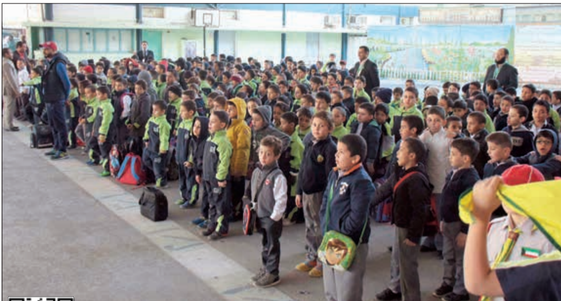
الطالبة في طابور الصباح