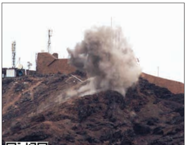
الدخان يتصاعد نتيجة الاشتباكات في عدن صباح أمس (أ.ف.ب)

عواصم - وكالات: قال وزير الدولة للشؤون الخارجية الإماراتية، أنور قرقاش أمس، إن موقف الإمارات من أحداث عدن داعم للتحالف العربي بقيادة السعودية. وأضاف قرقاش في تغريدة له على «تويتر» أنه لا عزاء لمن يسعى للفتنة من وراء أحداث عدن. إلى ذلك، عاد الهدوء الحذر إلى عدن أمس، عقب اشتباكات دامية بين قوات عسكرية وأمنية حكومية وفصائل مسلحة تابعة للانفصاليين الجنوبيين أسفرت عن سقوط أكثر من 15 قتيلًا وعشرات الجرحى. وفيما رحبت الحكومة اليمنية ببيان قيادة تحالف دعم الشرعية، الذي دعا جميع المكونات السياسية والاجتماعية اليمنية للتهديئة وضبط النفس والتمسك بلغة الحوار الهادئ، وتوجيه دقة