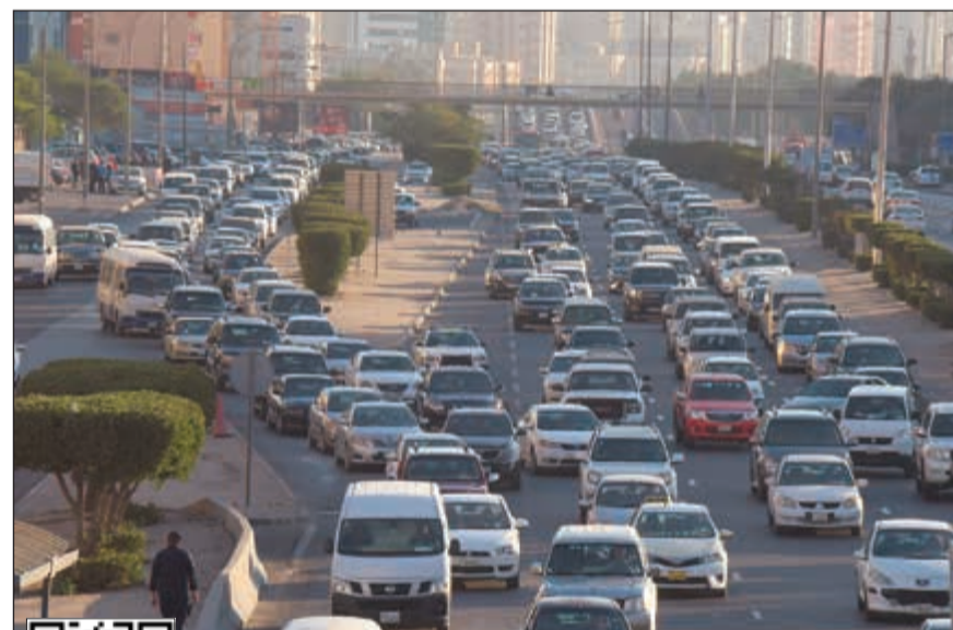
عاد الزحام إلى الشوارع بعد انتهاء اجازة منتصف العام