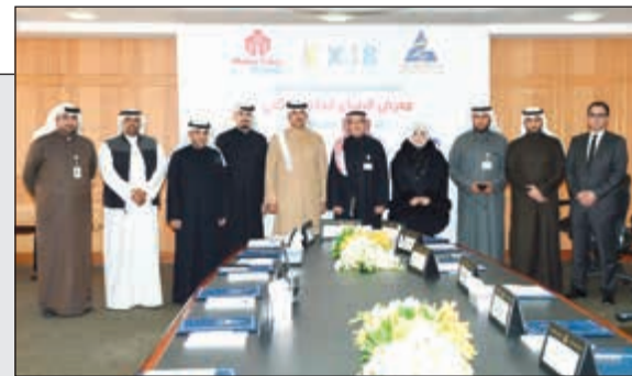
لقطة للمشاركين والجهات الراعية لمعرض «ميكرو فير 2018» يتوسطهم فواز الأحمد والشيخ نمر الصباح

«الكويتية للاستثمار» تطلق النسخة الثانية لمعرض «ميكرو فير 2018» 26