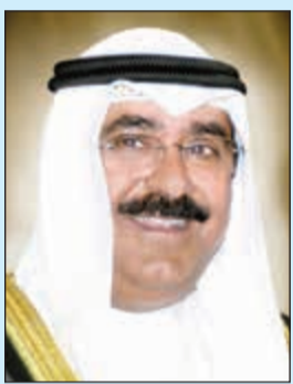
الشيخ مشعل الاحمد