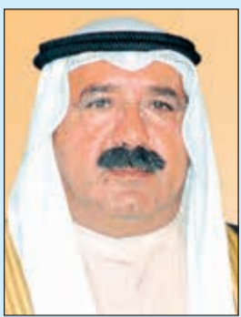
الشيخ ناصر صباح الاحمد