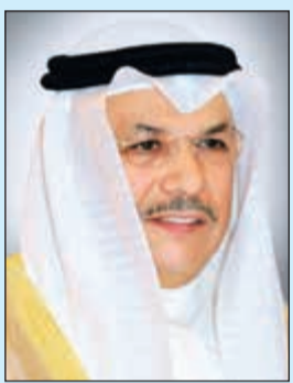
الشيخ خالد الجراح

بمناسبة مرور 12 عاماً على تولي سموه مقاليد الحكم