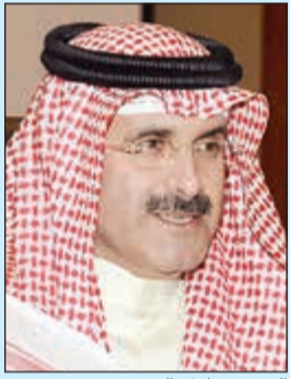
الشيخ مبارك الدعيج