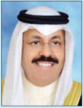
الشيخ احمد النواف

الغانم: الكويتيون يتعاملون مع سمو الأمير باعتباره جذراً سياسياً وأصلاً إستراتيجياً للكويت