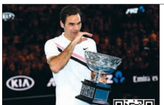
دموع السويدي فيدور نيهير بعد احرازه لقب بطولة استراليا المفتوحة للنسبة للمرة السادسة