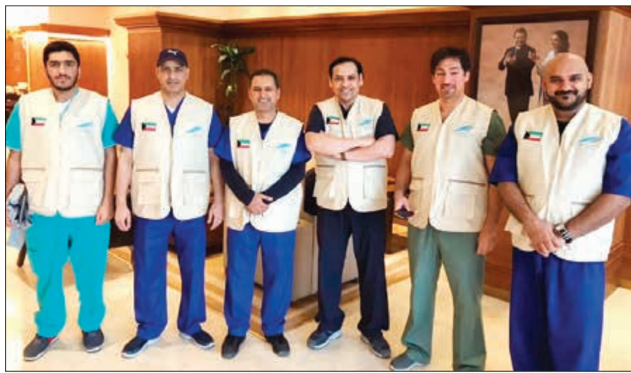
لقطة تذكارية للفريق الطبي المشارك بالحملة