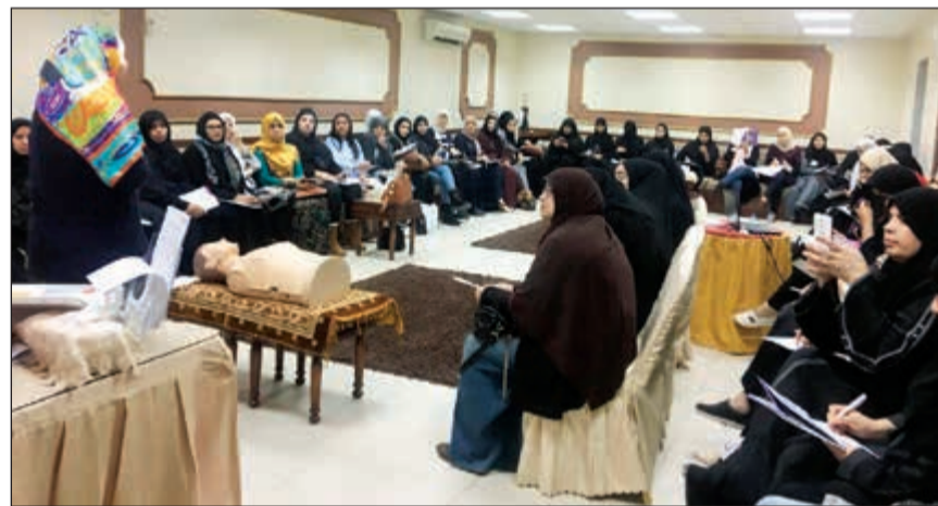
جانب من الحاضرات خلال الدورة