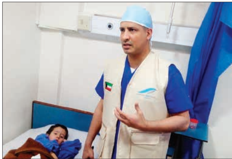
معالجة أحد الأطفال