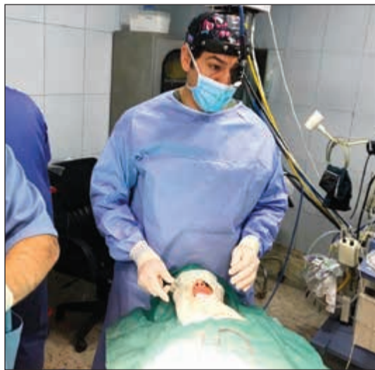
علاج لأحدى الحالات