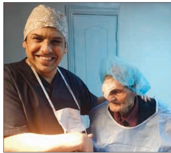
أحد المسنات بعد إجراء عملية جراحية لعينها