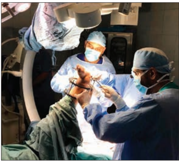
من إحدى العمليات الجراحية