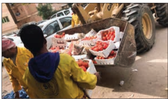
جانب من الحملة على السوق العشوائي في الأحمدية