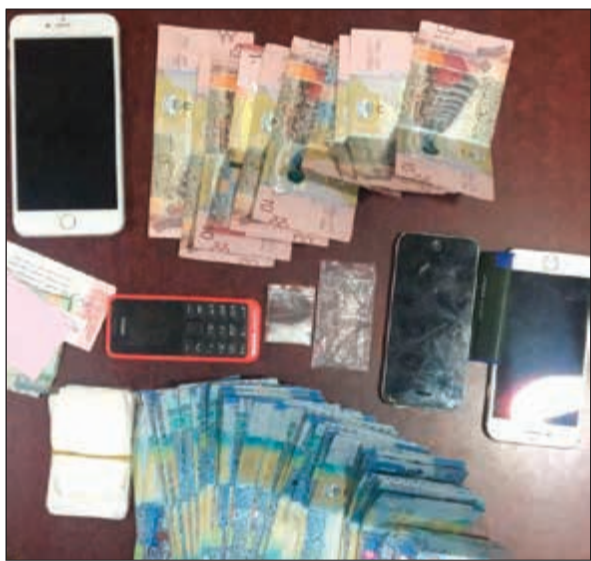
مواد مخدرة ومبالغ مالية ضبطت خلال حملات الأمن العام