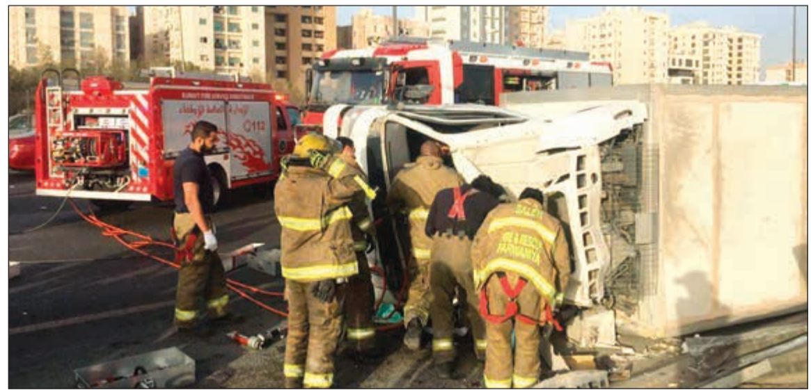
انقاذ المصابين في إحدى الحوادث