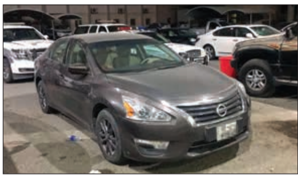
المركبة المطلوبة ستحال إلى مخفر العارضية

تقدم مواطن إلى مخفر شرطة الفحيحيل للإبلاغ عن سرقة محفظته من مركبة في منطقة الفحيحيل. ووفقا لمصدر أمني فإن مواطن أبلغ رجال أمن الفحيحيل بأنه فوجئ بعد خروجه من سوق بمنطقة