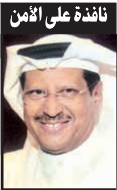
نافذة على الأمن

وكانت غرقة عمليات الداخلية قد تلقت اتصالا هاتفيا من فتاة قالت انها متواجدة في منطقة المنقف