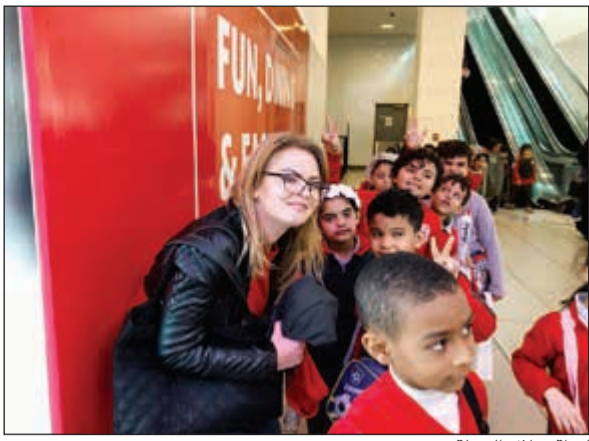
لقطة خلال الجولة