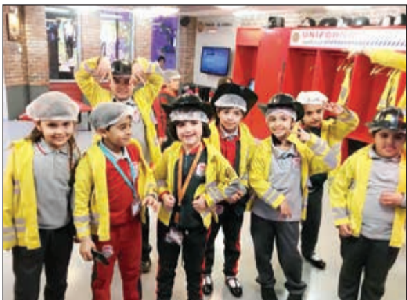
وفي مركز الإطفاء