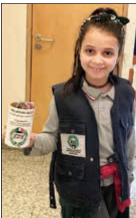
في جناح بيت الزكاة