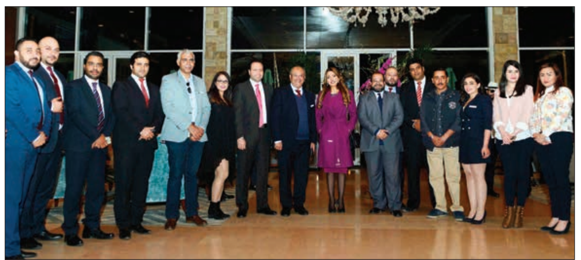
لقطة تذكارية لفريق موفتيك البدع