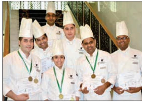
من الفائزين بمسابقة هوريكا