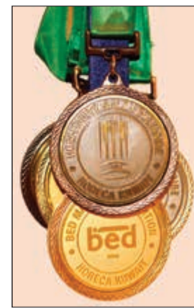
الميداليات التي فاز بها فريق ماريوت

بالإضافة إلى سلسلة من مسابقات العروض الحية، وذلك لإظهار المهارات العالمية التي يتمتع بها طهاة فنادق ماريوت الكويت. وقد شارك عدد كبير من موظفي فندق جي دبليو ماريوت الكويت وكورت يارد ماريوت الكويت في العديد من المسابقات، وحصدوا العديد من الميداليات والجوائز التقديرية، منها ميداليتان ذهبيتان في مسابقة الأطباق الكويتية ومسابقة تحضير الأسرة، كما فازوا بميداليتين فضيتين في مسابقة الباستا ومسابقة السوشي، ميداليتين برونزيتين في مسابقة كيكة الأعراس ومسابقة الساندوتشات، إضافة إلى 8 شهادات تقديرية في مسابقات أخرى. وتعتبر