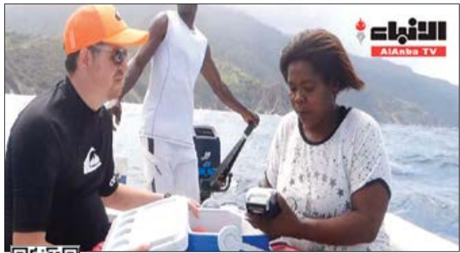
معاناة رودريغيس في الوصول إلى مكان تتوافر فيه شبكة الهاتف