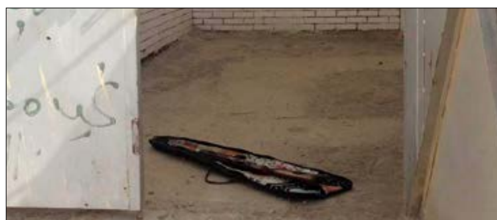
السلاح الرشاش وقد اقي به داخل المحول

فوجئ عدد من الفنيين العاملين بوزارة الكهرباء والماء عند دخولهم أحد المحولات الكهربائية في منطقة جليب الشيوخ لأجل الصيانة وأثناء فتح باب المحول، بالعثور على «بنديّة شوزن» مرمية داخل حوش المحول، وعليه تم إبلاغ عمليات وزارة الداخلية التي أرسلت على الفور إحدى الدوريات الأمنية لمخفر الجليب وتم رفع السلاح من المكان وأحيل إلى المخفر، وعليه تم تحويل السلاح إلى إدارة مباحث السلاح وجار العمل لمعرفة ما إذا كان تم استخدام السلاح بأي جريمة، كما تقوم الأجهزة المعنية برفع البصمات عنه للتأكد من صاحب الشوزن.