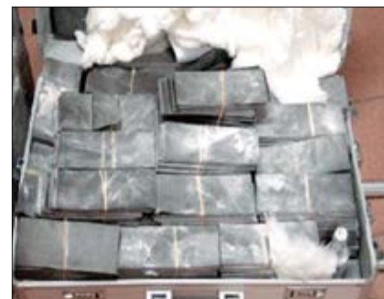
أوراق سوداء تعرضها عصبات نصب باعتبارها دولارات

قدم رجال الامن العام الى رجال المباحث الجنائية وكما يقال على طبق من ذهب 5 نصابين شرعوا في ترويح وهم الثراء ولكن شاء حظهم العاثر ان يوقعهم في شر أعمالهم، فأوقفهم احد رجال الامن العام والذي لم يتردد لحظة في إبلاغ مديرين ليتم توقيف النصابين وأحالة 5 منهم 4 قيد التوقيف والخامس وضع في قوائم المطلوبين، وجار استكمال التحقيقات مع المتهمين الموقوفين لمعرفة ما اذا كانت عملياتهم قد طالت آخرين او تمكنوا من بيع الوهم ام ان تجربتهم مع رجل الأمن كانت الاولى. هذا وقامت وزارة الداخلية بالتعاون مع مديرية أمن حولي بعملية، حيث خرجت قوة بقيادة اللواء