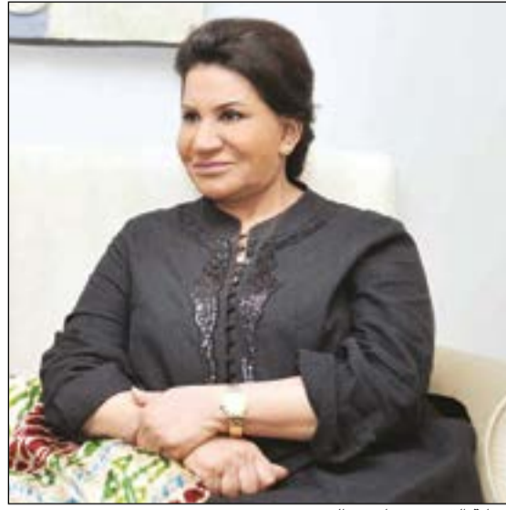
الفنانة القديرة سعاد عبدالله