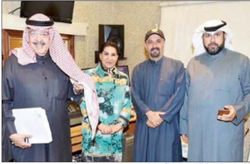
أثناء تصوير الفيلم الوثائقي عن الراحلة سعاد الحميضي