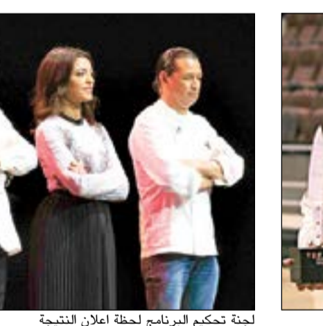
لجنة تحكيم البرنامج لحظة اعلان النتيجة