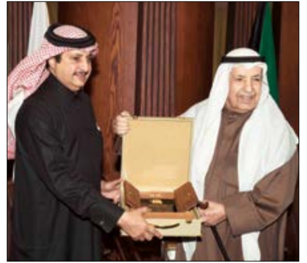
علي الغانم مكرما الشيخ خليفة آل ثاني