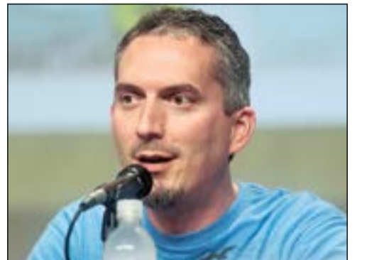
مؤلف «عداء المتاهة» جيمس داشنر

«Maze Runner»، أو «عداء المتاهة» هو فيلم إثارة وخيال علمي وحركة أميركي، من إنتاج عام 2014، أخرجه ويس بول وسيناريو نواه أوبنهايم، وهو مستوحى من قبل رواية تحمل نفس الاسم للكاتب جيمس داشنر، المولود في 26 نوفمبر 1972، وهو كاتب خيال تأملي أميركي، بالدرجة الأولى لسلاسل الأطفال والشباب البالغين، كسلسلة «عداء المتاهة» وسلسلة الفانتازيا «الواقع الثالث عشر» وصدرت في 2009. وطرح الفيلم في 19 سبتمبر 2014 بالولايات المتحدة وقبلها بعدة أيام في الشرق الأوسط، وتلقى أصداء إيجابية بشكل عام، مع مديح لأداء الممثلين، إضافة إلى الحبكة المثيرة للاهتمام وأسلوب الفيلم السوداوي الممتع، وقد اعتبر من أفضل الأفلام المبنية على روايات المراهقين، كما حقق نجاحا في شبكات التذاكر، حيث وصلت إيراداته العالمية لأكثر من 340 مليون دولار مقابل ميزانية بلغت 34 مليون دولار.