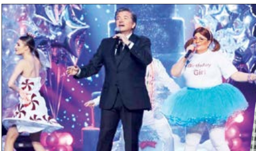
توفيق في برنامج «ديو المشاهير»

عجبتني كلماتها التي تقول «عاشق أنا سيدي.. نعم من راسي ليه حتى القدم» وهي كلمات شعبية بسيطة لكنها الموسيقار طلال بأسلوب جديد، وأنا شخصيا متفائل بالأغنية وأتمنى أن تتألق