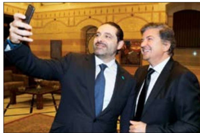
النجم العربي وليد توفيق وسليفي، مع رئيس الوزراء سعد الحريري