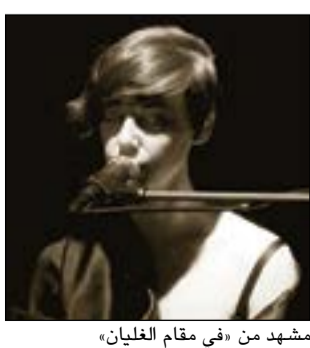
مشهد من «في مقام الغليان»

في محطتها السابعة، افتتحت مسرحية «في مقام الغليان» أصوات من ربيع مختلف» للمخرج الكويتي العالمي سليمان البسام عروضها في مدينة بوسطن الأميركية مساء امس الأربعاء على خشبة مسرح روبرت أورشايد بمركز إيمرسون. وفي هذا الصدد قال البسام: «افتتحتنا امس سلسلة من ستة عروض على خشبة مسرح روبرت أورشايد بجامعة بوسطن بدعوة من مركز إيمرسون للفنون، معتبرا أن تقديم العمل في بوسطن تنويع للرحلة العالمية للعرض التي شملت ست محطات بنسخته الثانية وثلاث محطات بنسخته الأولى.