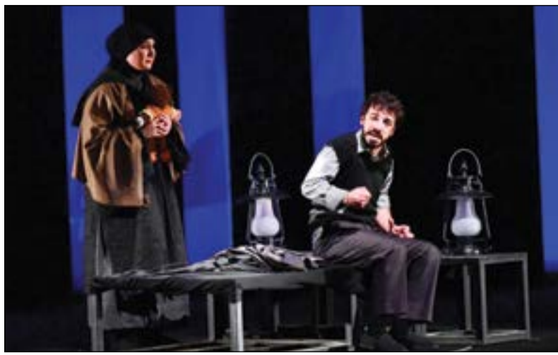
مشهد من مسرحية «الرحمة»