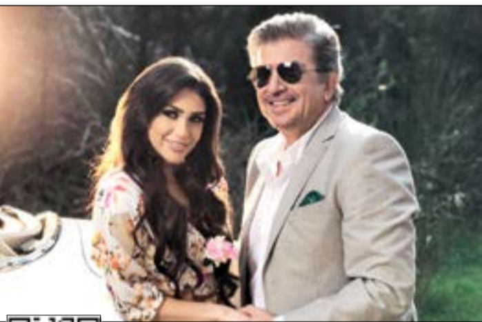
مشهد من كليپ أغنية «عاشق أنا»