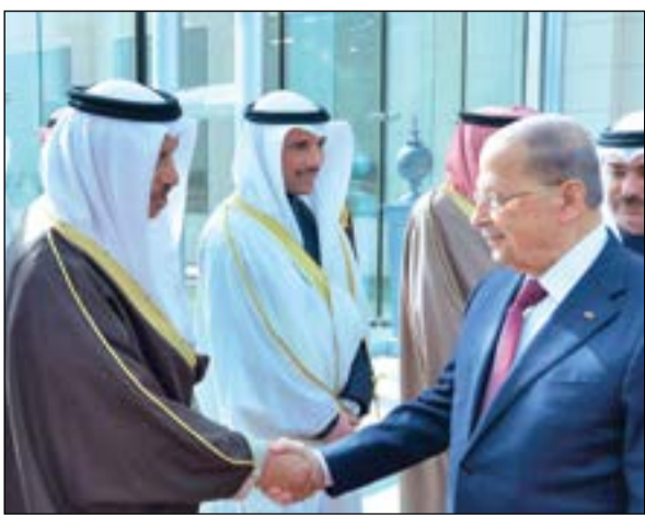
..وسمو رئيس الوزراء الشيخ جابر المبارك مودعا الضيف