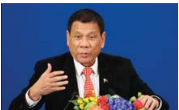
الرئيس الفلبيني رودريجو دوتيرتي