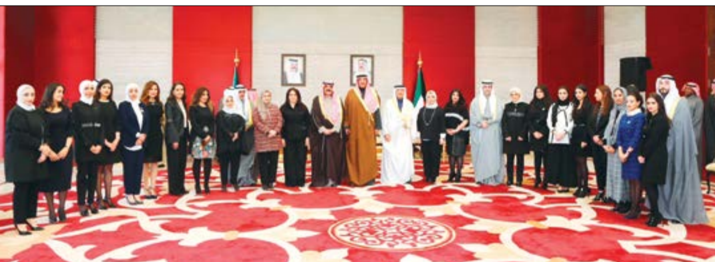
الشيخ صباح الخالد وخالد الجارالله والسفير عبدالعزيز الشارخ مع الدبلوماسيين والديبلوماسيات