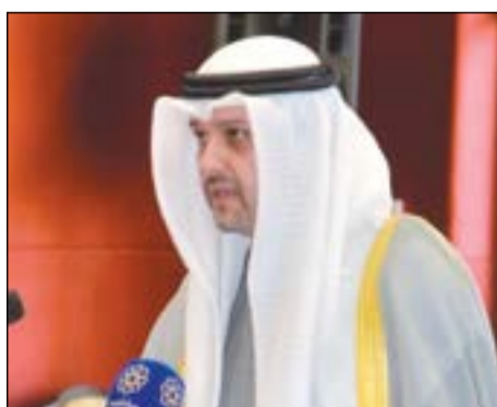
الملحق الدبلوماسي سالم الغانم