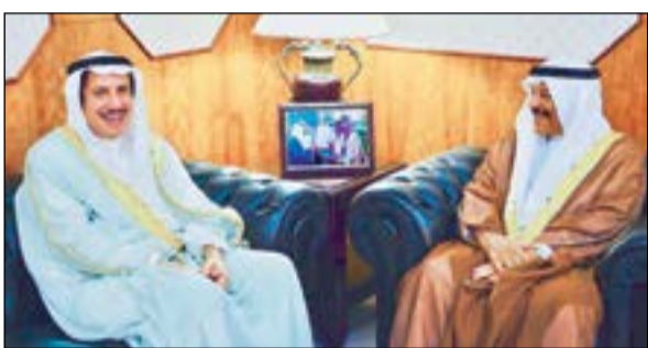
السير الشيخ عزام الصباح خلال لقائه مع رئيس مجلس الشورى البحريني علي الصالح

المرحلة الحساسة في المنطقة، مؤكدا أننا على ثقة بحكمة قادة دول مجلس التعاون الخليجي في تجاوز هذه التحديات.