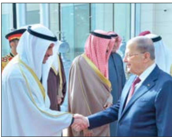
مرزوق الغانم مودعا العماد ميشال عون