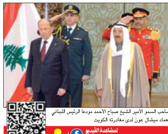
صاحب السمو الأمير الشيخ صباح الأحمد مودعا الرئيس اللبناني العماد ميشال عون لدى مغادرته الكويت