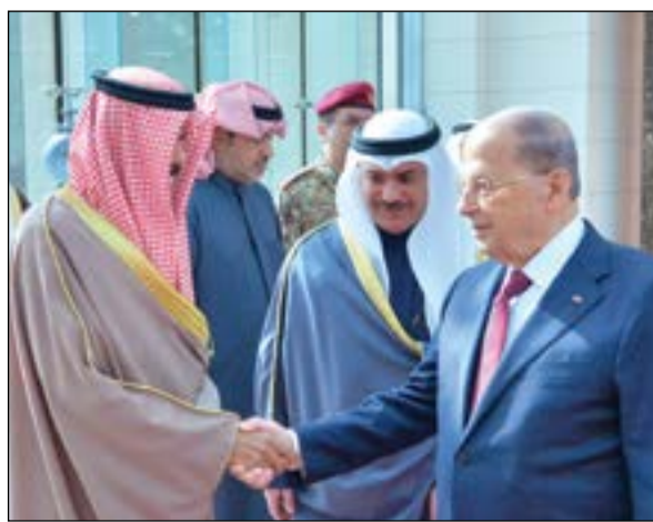
سمو ولي العهد الشيخ نواف الأحمد مصافحا الرئيس اللبناني قبل مغادرته