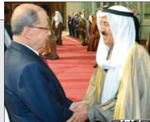
صاحب السمو الأمير المشايخ صباح الأحمد مودعا الرئيس اللبناني العماد ميشال عون لدى مغادرته أمس

ثأل مرة في الكويت شاهد الصفحة بتقنية الواقع المعزز Zappar تطبيق