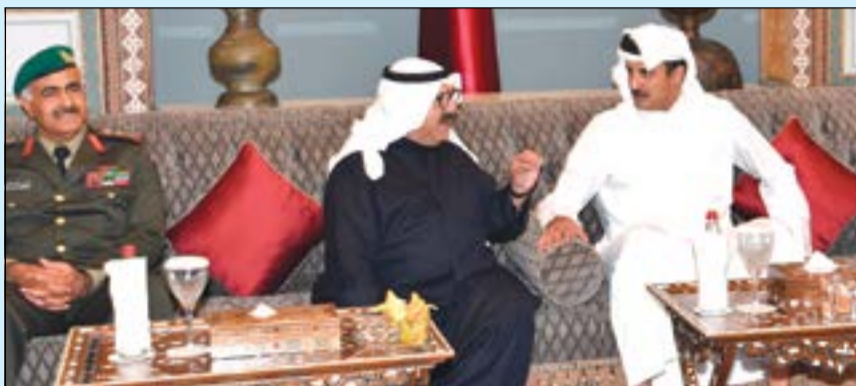
صاحب السمو الشيخ تميم بن حمد لدى استقباله الشيخ ناصر صباح الأحمد وبيدو الفريق الركن محمد الخضر ضمن الوفد المرافق لوزير الدفاع

الدوحة - كونا: استقبل أمير دولة قطر سمو الشيخ تميم بن حمد آل ثاني في قصر البحر أمس النائب الأول لرئيس مجلس الوزراء ووزير الدفاع ناصر صباح الأحمد والوفد المرافق له. ونقل النائب الأول لرئيس مجلس الوزراء ووزير الدفاع تحيات صاحب السمو الأمير القائد الأعلى للقوات المسلحة الشيخ صباح الأحمد لأخيه أمير دولة قطر مؤكداً على عمق العلاقات الأخوية بين البلدين الشقيقين. حفل جانبه، حفل سمو الشيخ تميم النائب الأول لرئيس مجلس الوزراء ووزير الدفاع تحياته إلى أخيه صاحب السمو الأمير وتمنياته لسموه بموفور الصحة والعافية.