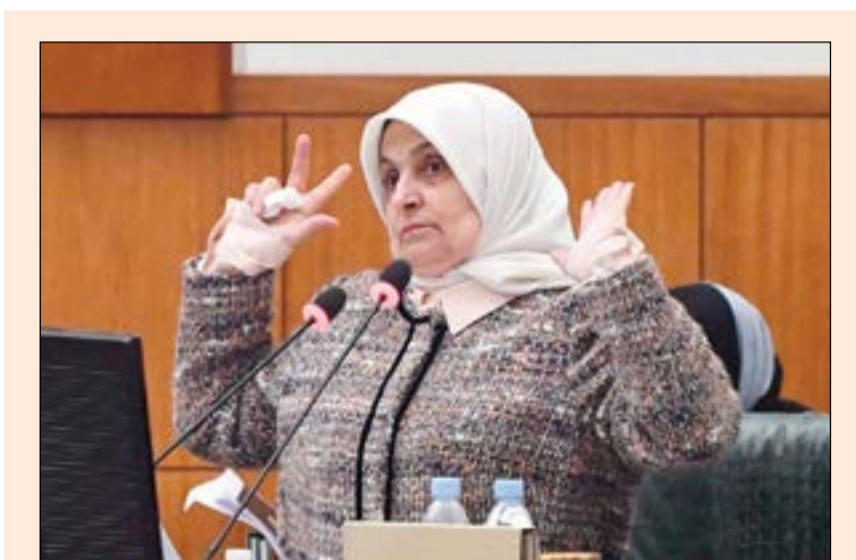
الوزيرة هند الصباح.. ثقة كاملة في الحصول على الثقة