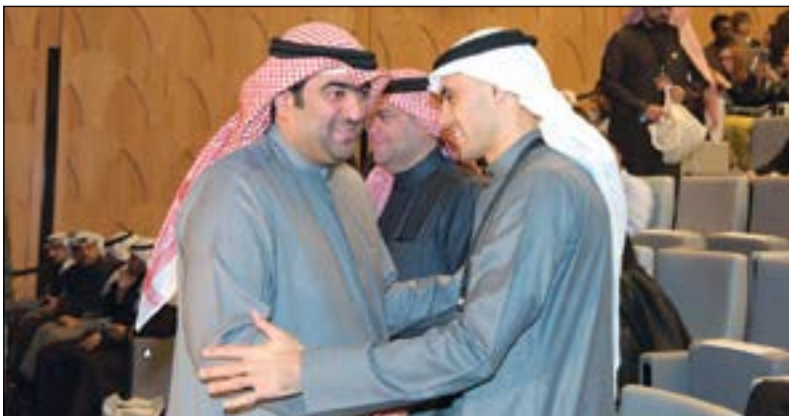
خالد الروضان ويدر ناصر الخرافي خلال افتتاح منتدى الثروة البشرية

أعلن وزير التجارة والصناعة ووزير الدولة لشؤون الشباب خالد الروضان عن وجود توجه لإلغاء هيئة الشباب ودمجها مع وزارة الشباب، مبيناً أن تقليص الهيئات ودمجها مع الوزارات أحد متطلبات خطة التنمية لما فيه من ترشيد للإنفاق ودمج للأعمال المتشابهة لجني الفائدة الكبرى والتركيز الأكثر على الأهداف، مضيفاً أن هناك خططاً تطويرية متعددة للشباب لتحقيق التنافسية التي تسعى إليها جميع الدول باستقطاب رأس المال البشري. وشدد الروضان خلال افتتاح منتدى الثروة البشرية أمس على أهمية تطوير الأفراد لثقافتهم وفكرهم الإبداعي، مشيراً إلى أن تدريب وتأهيل الكوادر الشبابية بات من الأهداف الأساسية ومسؤولية حكومية لتطوير أداؤهم. واختتم حديثه بهذين البيتين للإمام الشافعي رداً على من أساء إليه: