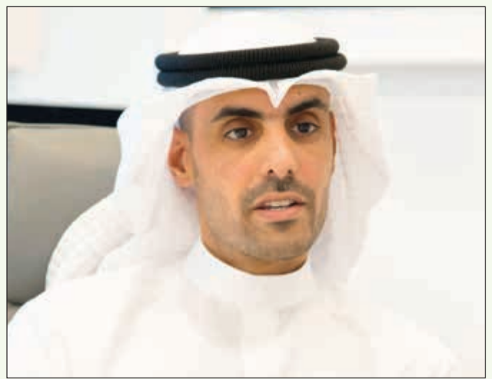
بدر ناصر الخرافي

والضرائب والإستهلاك والإطفاء 34٪. وأعلنت الشركة عن الوفاء بجميع الالتزامات المالية المستحقة وسداد قسط المراجعة البالغ 1,3 مليار ريال. وتعليقاً على هذه النتائج السنوية، قال نائب رئيس مجلس الإدارة والرئيس التنفيذي في مجموعة زين ونائب رئيس مجلس إدارة شركة زين السعودية بدر ناصر الخرافي: «الأداء المميز لشركة زين السعودية جاء نتيجة للالتزام الجاد بتنفيذ إستراتيجية الشركة التي تهدف إلى زيادة الاستفادة من خدمات البيانات والخدمات الرقمية، والتركيز المستمر على تطوير كفاءة التشغيل، بالإضافة إلى الجهود الإيجابية للإدارة في هيكله تكاليف الشركة». وأضاف الخرافي قائلاً: لأول مرة تحقق شركة زين السعودية أرباحاً