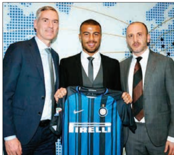
انتر يقدم رافينيا

توصل برشلونة متصدر الدوري الإسباني لكرة القدم وانتر ميلان الإيطالي الى اتفاق حول إعاره لاعب الوسط الدولي البرازيلي رافينيا من الاول الى الثاني حتى نهاية الموسم.