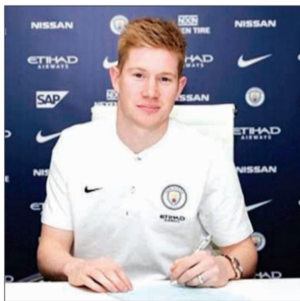
البلجيكي وتوقيع العقد الجديد

مدد صانع الألعاب البلجيكي كيفن دي برون عقده مع مان سيتي حتى 2023، وذلك بحسب ما أعلن متصدر ترتيب الدوري الإنجليزي الممتاز لكرة القدم اول من امس. وفرض اللاعب البالغ 26 عاما نفسه أحد أفضل لاعبي سياتي هذا الموسم، ولعب دورا مؤثرا جدا في تصدر فريق المدرب الإسباني جوسيب غوارديولا لترتيب الدوري الممتاز بفارق مريح جدا.