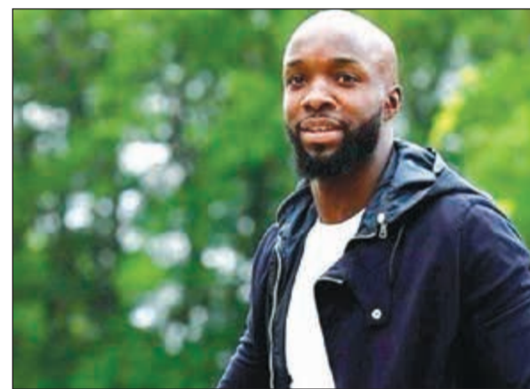
الفرنسي الخضرم ديارا

يتحضر لاعب الوسط الفرنسي لاسانا ديارا للالتحاق بباريس سان جرمان، منصرف الدوري المحلي لكرة القدم، بعدما شوهد خارجا من أحد مستشفيات العاصمة إثر خضوعه، بحسب ما يعتقد، للفحص الطبي الروتيني. ونشرت صحيفة «لو باريزيان» في حسابها على موقع تويتر مقطع فيديو يظهر ديارا (32 عاما) وهو يخرج من المستشفى الأميركي في باريس، ثم ذكرت لاحقا ان لاعب وسط ريال مدريد الإسباني السابق خضع للفحص الطبي وتجاوزه بنجاح. وسبق لصحيفة «ليكيب» الرياضية ووسائل اعلام محلية اخرى أن ذكرت أن ديارا سيوقع مع سان جرمان عقدا لمدة عام ونصف من أجل سد الفراغ في خط الوسط الدفاعي، لاسيما في ظل إصابة الإيطالي-البرازيلي تياغو موتا.