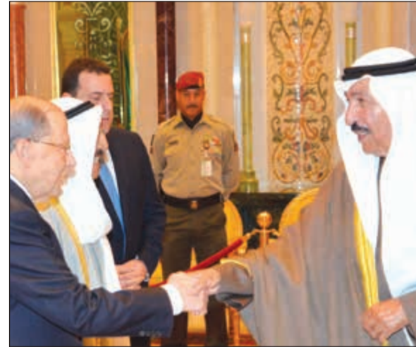
الشيخ جابر عبدالله مصافحا الرئيس عون