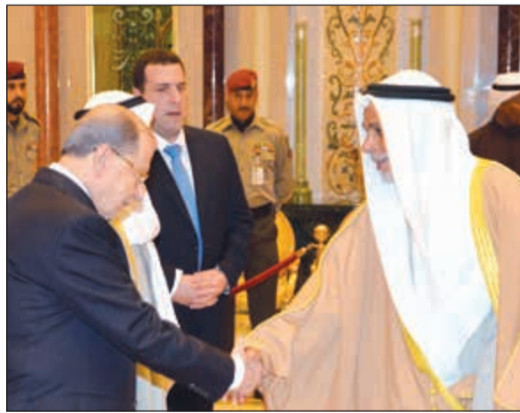
المستشار يوسف المطاوعة مصافحا الرئيس عون