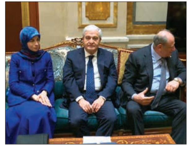
الوزراء اللبنانيون عناية عز الدين وأيمن شقير وجمال الجراح