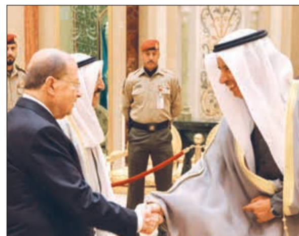
المستشار د. يوسف الإبراهيم مرحبا بالرئيس عون