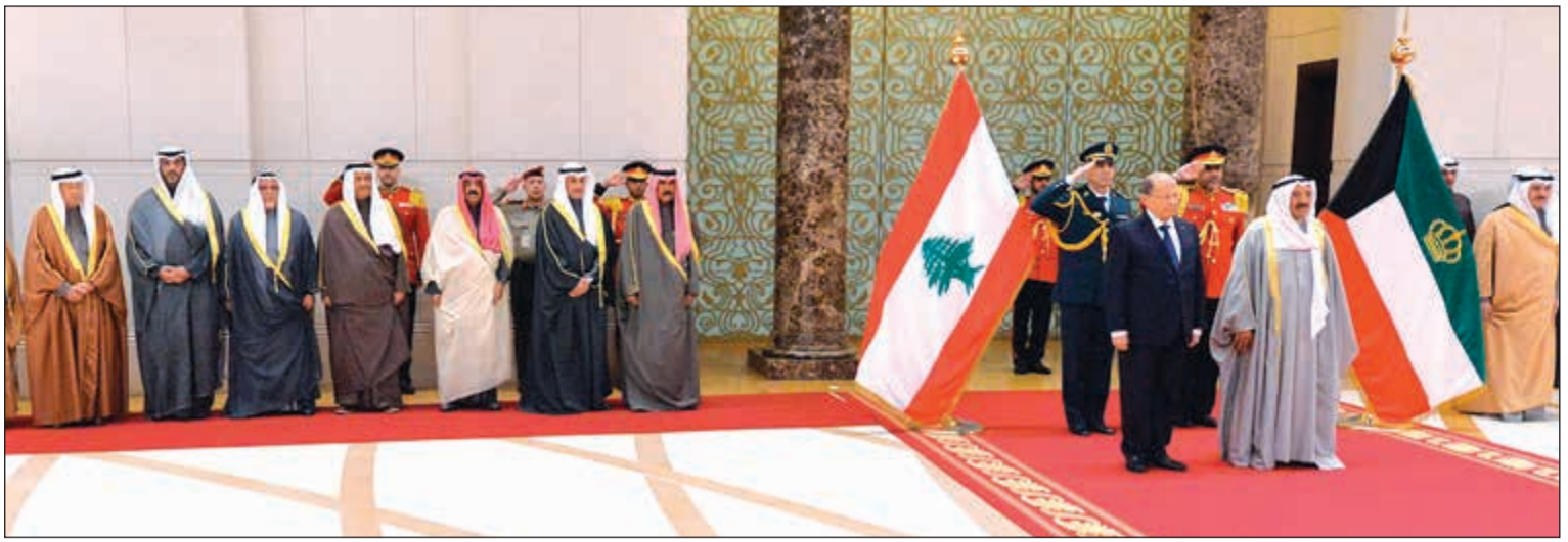
صاحب السمو الأمير الشيخ صباح الأحمد مستقبلاً الرئيس اللبناني العماد ميشال عون بحضور سمو ولي العهد الشيخ نواف الأحمد ومرزوق الغانم والشيخ مشعل الأحمد وسمو الشيخ جابر المبارك والشيخ علي الجراح والشيخ محمد عبدالله والسفير أحمد فهد الفهد