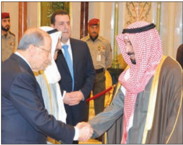
الشيخ علي الجابر مرحبا بالرئيس عون

هذا، وساد المباحثات جو ودي عكس روح الاخوة التي تتميز بها العلاقة والرغبة المتبادلة في المزيد من التعاون والتنسيق في كل الأضعدة.