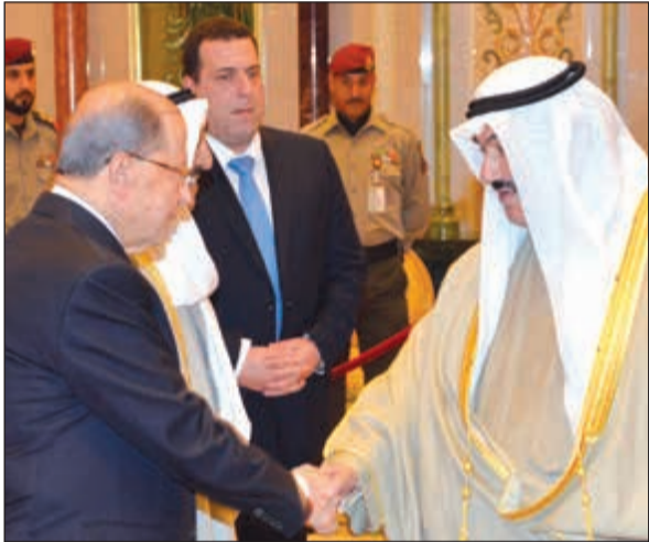
سمو الشيخ ناصر المحمد مصافحا الرئيس اللبناني