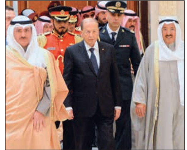
صاحب السمو الأمير والرئيس اللبناني ويبدو الشيخ خالد عبدالله