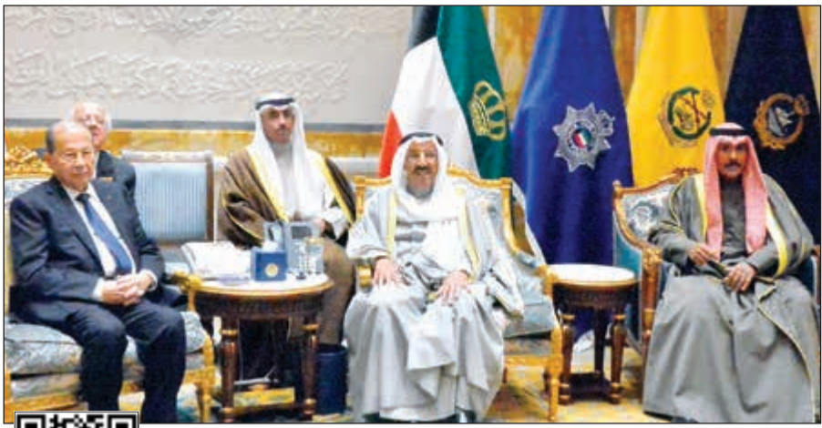
صاحب السمو الأمير وسمو ولي العهد والرئيس اللبناني خلال المباحثات الثنائية