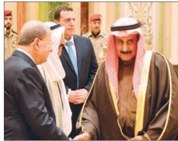
الشيخ د. إبراهيم الدعيج يرحب بالعماد ميشال عون