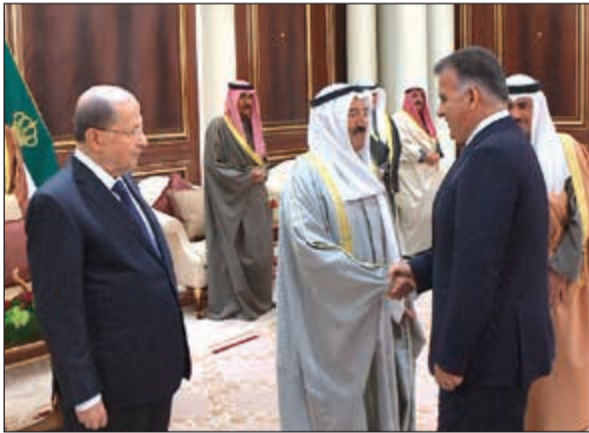
صاحب السمو مصافحا اللواء عباس إبراهيم