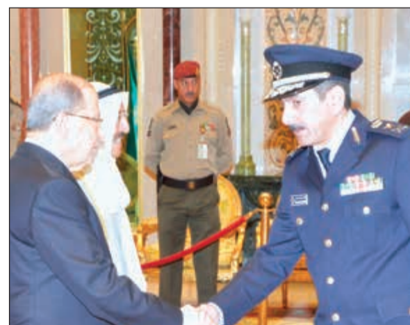
الفريق خالد المكراد مرحبا بالرئيس اللبناني