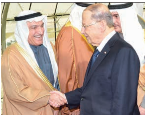
الرئيس اللبناني مصافحا المستشار محمد أبو الحسن لدى وصوله