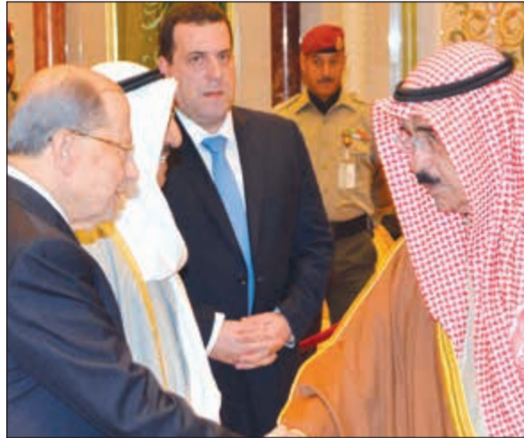
الشيخ فيصل السعود مرحبا بالرئيس اللبناني