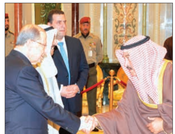
الشيخ د. سالم الجابر مصافحا الرئيس عون