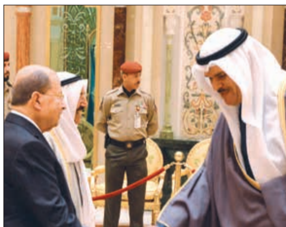
الشيخ سلمان الحمود يصفح ضيف الكويت