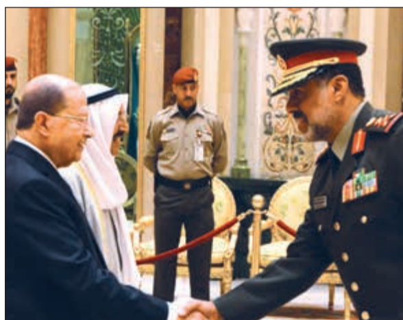
الفريق الركن الشيخ عبدالله النواف مصافحا ضيف الكويت