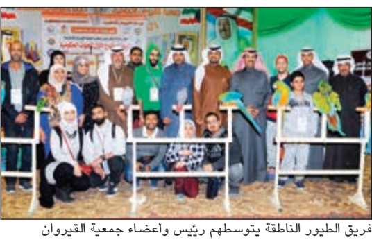
فريق الطيور الناطقة يتوسطهم رئيس وأعضاء جمعية القيروان