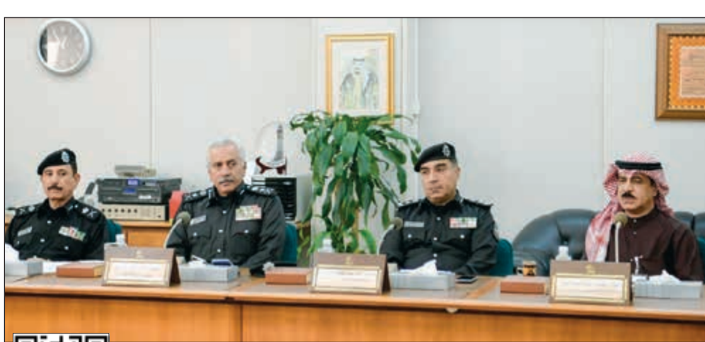
الفريق محمود الدوسري وأركان وزارة الداخلية خلال اجتماع لجنة حقوق الانسان

عادل الشنان كشفت مصادر مطلعة في المؤسسة العامة للرعاية السكنية لـ «الأنباء» أن المؤسسة انتهت من تخطيط وتصميم مشروع السكن منخفض التكاليف في مشروع النعيم ليكون بديلاً عن منطقتي الصليبية وتيماء الشعيبتين. وأضافت المصادر أن المشروع سيضم نحو 10 آلاف وحدة سكنية للسكن الخاص بمساحة