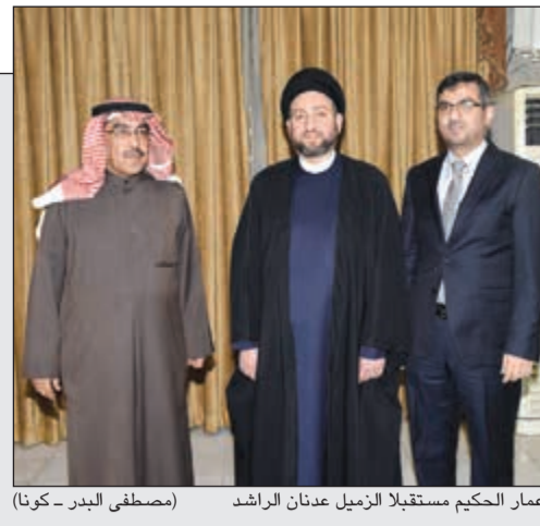
عمار الحكيم مستقبلاً الرميل عدنان الراشد

رئيس تيار الحكمة العراقي عمار الحكيم لوفد إعلامي كويتي: مؤتمر «إعادة الإعمار» يزيد بصمة الكويت في دعم العراق 14