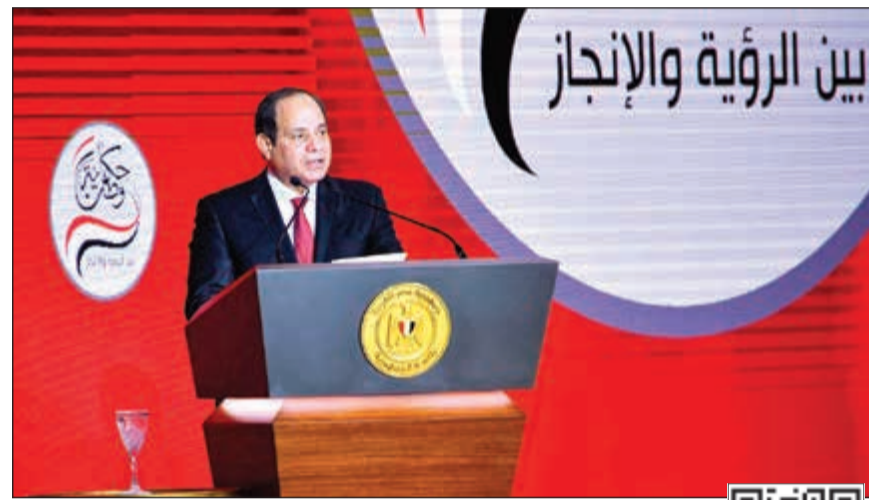
الرئيس عبد الفتاح السيسي خلال إعلان قرار الترشيح لفترة رئاسية ثانية

مساء يومياً وحتى يوم 29 يناير والذي يكون تلقي طلبات الترشيح فيه حتى الساعة الثانية ظهراً. وقد كشف نائب رئيس الهيئة الوطنية للانتخابات والمتحدث الرسمي باسمها المستشار محمود الشريف، أن تأييدات المواطنين بمكاتب الشهر العقاري بلغت 650 ألف توكيل حتى الآن، وقد حددت الهيئة لمدة 3 أيام بالنسبة لتقديم الطلبات المتضمنة الرغبة في متابعة الانتخابات فيما يقوم المتابعون لهذه المنظمات بتسجيل بياناتهم حتى تاريخ 26 يناير الجاري وتصدر لهم الهيئة التصاريح لن تم قبول طلبه. وعلن الشريف موافقة الهيئة على الطلبات المقدمة من بعض المنظمات المصرية وهي منظمات، مؤسسة «مصر السلام» للتعليمية وحقوق الإنسان، ومؤسسة ماعت للتعليمية والسلام وحقوق الإنسان، ومؤسسة شركاء من أجل التنمية، وجمعية المنظمة المصرية لحقوق الإنسان من جانبه، أكد المستشار علاء فؤاد المدير التنفيذي للهيئة الوطنية للانتخابات أنه يحق لرأغبى الترشيح في الانتخابات