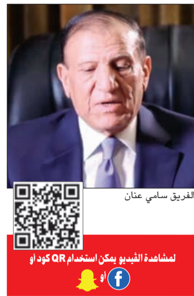
الفريق سامي عنان