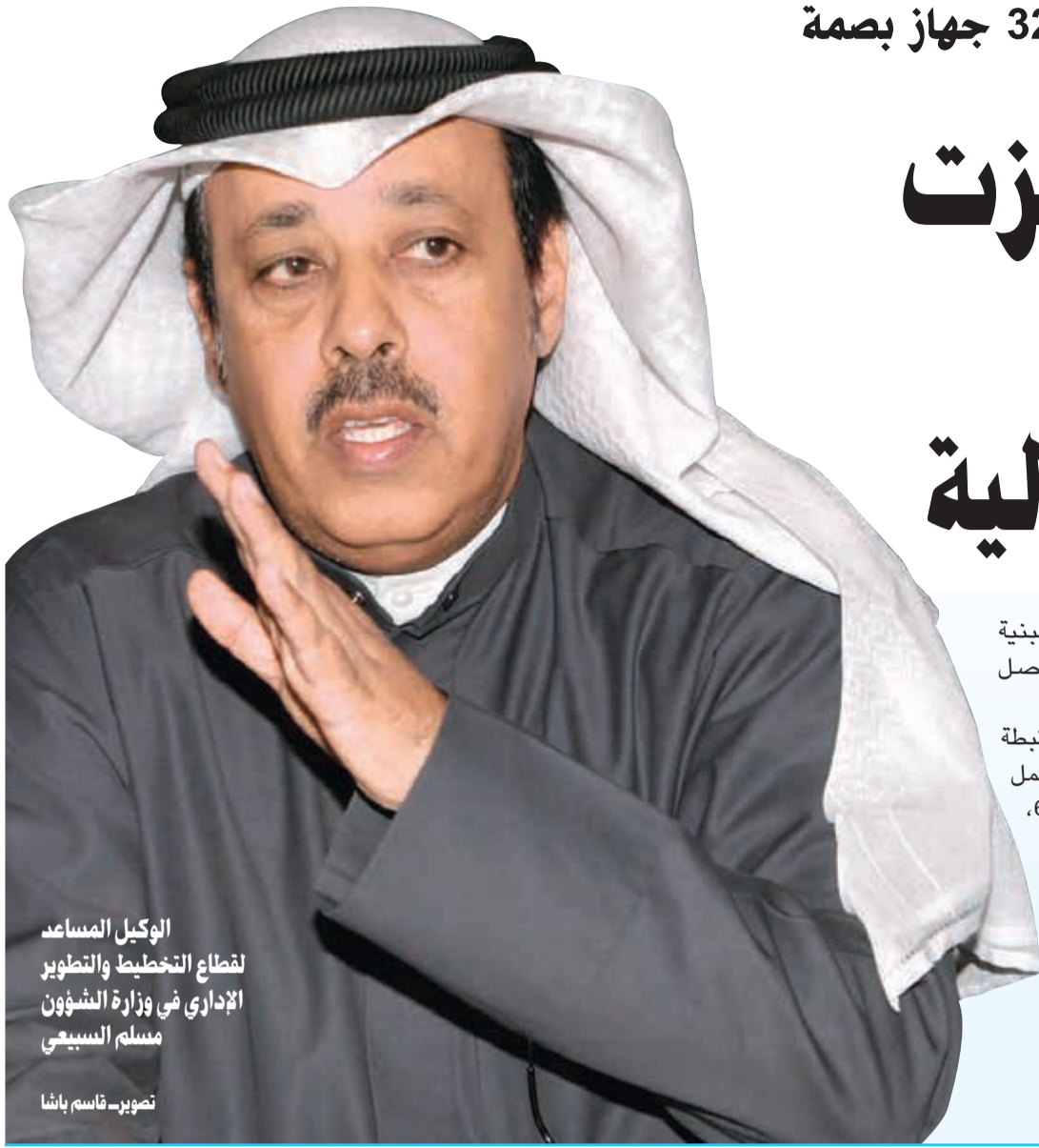
الوكيل المساعد لقطاع التخطيط والتطوير الإداري في وزارة الشؤون مسلم السبيعي