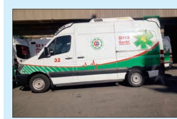
أحدى سيارات الإسعاف الجديدة

الفضلي: من أعراض «كرونز» الإسهال والتشنج والآلام في البطن وفقدان الوزن والحمى