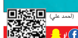
يمكن استخدام QR كود أو مشاهدة الفيديو

من جهة، نكر راداكيسون أن جامعة بابسون تسعى دائماً إلى تطوير مناهج ريادة الأعمال من خلال دعم الهيئات والمؤسسات غير الحكومية وغير الربحية، مؤكداً أن جامعة بابسون تتخذ برامج ريادة الأعمال الاجتماعية كأولوية في برامج الدراسات العليا، مبرحاً عن سعادته بالتعاون مع مؤسسة لويك، معبراً عن امتنانه للفرصة التي أتاحتها لويك إلى جامعة بابسون في الوصول إلى القطاع الخاص والقطاع العام والقطاع التعليمي في الكويت.