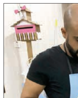
أحد المشاركين في المسابقة

سأهم في إحياء هذا التراث البحري الغني لاسيما بين أوساط الشباب وانتقاله من جيل إلى جيل.