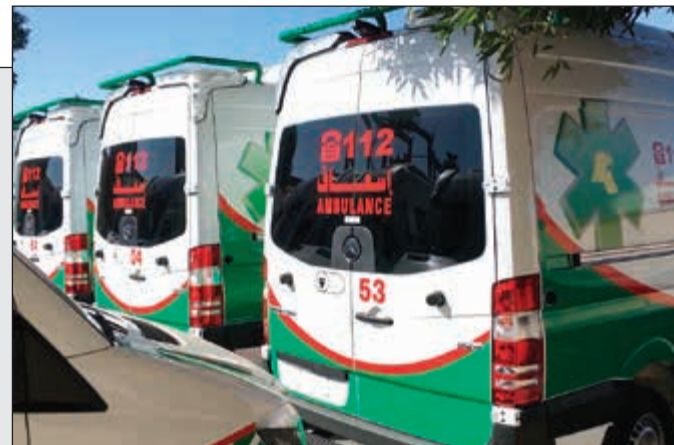
عدد من سيارات الإسعاف الجديدة بعد وصولها إلى ميناء الشويخ

79 سيارة إسعاف جديدة ومتطورة وصلت إلى الكويت وستدخل الخدمة قريبا