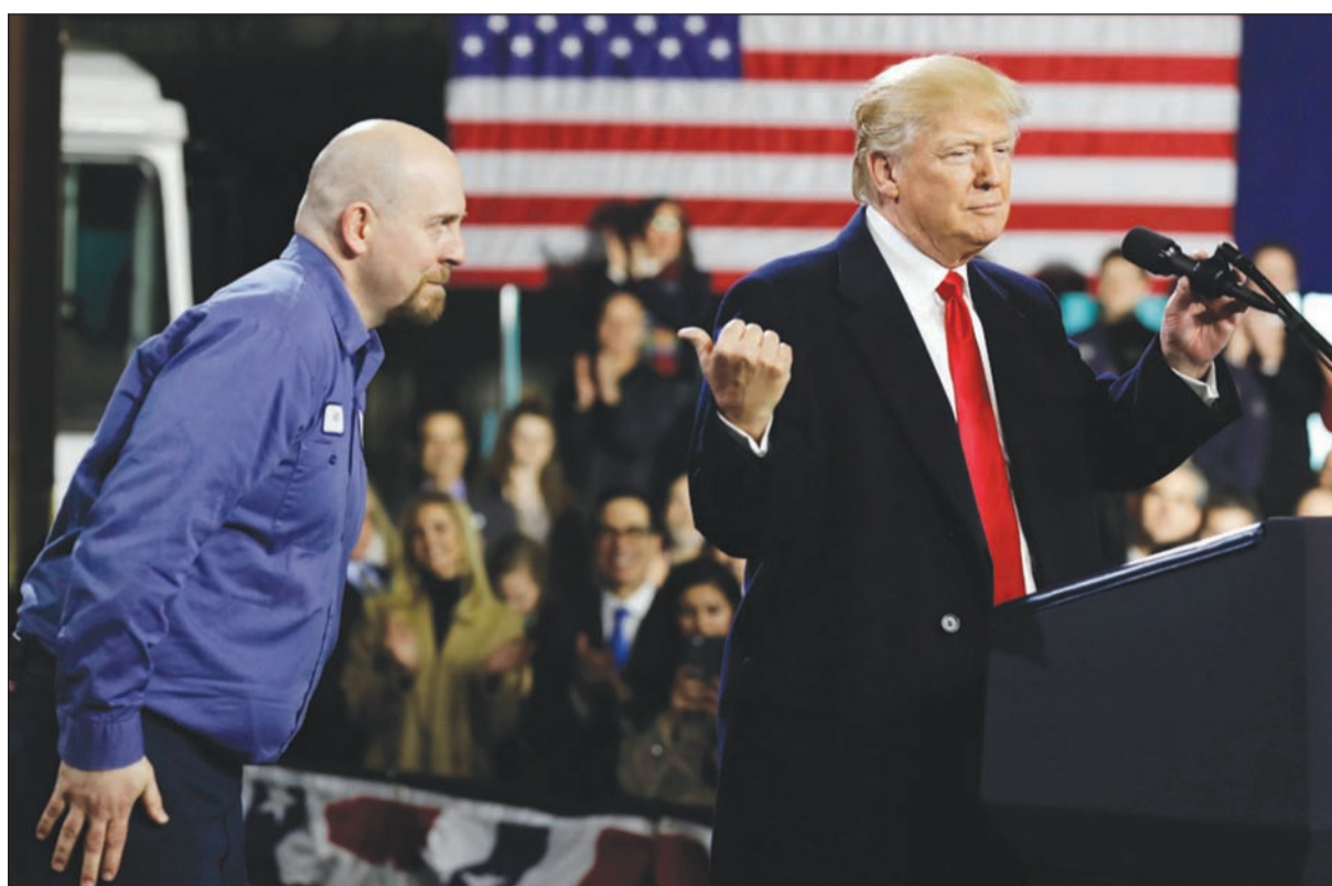
الرئيس ترامب أثناء القائه كلمة عن سياسته الاقتصادية والضريبية بأحد مصانع بنسلفانيا أمس الأول

شأن تعليق شيف وأبلغ شبكة (سي.ان.ان) بأن سيمبسون «لم يقدم دليلاً واعتقد أن هذه نقطة مهمة، ما قاله مجرد مزاعم» من جهتها، رفضت منظمة ترامب هذه