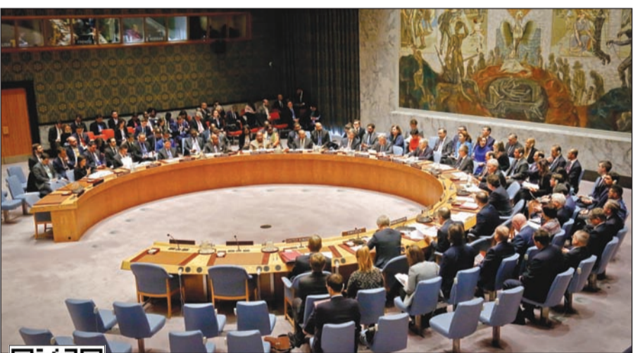
جانب من اجتماع مجلس الأمن الدولي أمس الأول