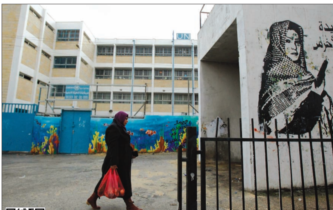
فلسطينية تسير أمام مدرسة تمولها وكالة «أوتروا» في مخيم الدهيشة قرب بيت لحم بالضفة

ولفت «ديلي تلغراف» إلى أن جونسون يعتقد أن جسراً على القنال بطول 35.2 كيلومتراً وبنموذج من القطع الخاص قد يكون خياراً في الوقت الحالي وسيوفر الطاقة الاستيعابية اللازمة لزيادة السياحة والتجارة بعد الخروج من الاتحاد الأوروبي.