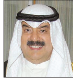
خالد الجار الله

الخارجية خالد الجار الله التي التعبير عن استغرابه وأسفه لما ورد في تصريح الرئيس الفلبيني، خصوصا أن الكويت