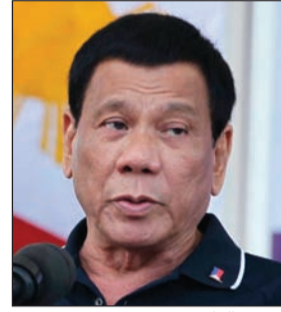
رئيس الفلبين رودريغو دوتيرتي

تتمتع بعلاقات مميزة مع الأصدقاء في الفلبين وتسعى لتطويرها وتعزيزها. وأضاف الجار الله «باشرنا على الفور الاتصال بالسلطات الفلبينية لمعرفة حقيقة وأبعاد هذا التصريح والعمل على تنفيذ ما ورد فيه من معلومات مغلوبة». وأوضح أن «إجمالي العمالة الفلبينية في الكويت تجاوز الـ 170 ألفاً، ولا يمكن أخذ الحالات الأربعة التي وردت في تصريح الرئيس الفلبيني للاستدلال أو القياس على وضع العمالة الفلبينية». متابعا: «تم اتخاذ الإجراءات القانونية تجاه