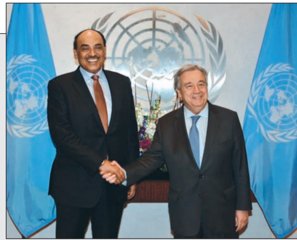
الشيخ صباح الخالد خلال لقائه الأمين العام للأمم المتحدة أنطونيو غوتيريس

أمين عام الأمم المتحدة خلال لقائه صباح الخالد: إسهامات بناءة تقوم بها الكويت لدعم أعمال وأجهزة المنظمة الدولية