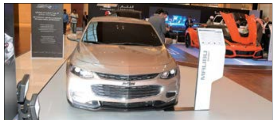
شركة يوسف أحمد الغانم - شيفروليه