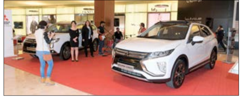
الملا موتورز - ميتسوبيشي