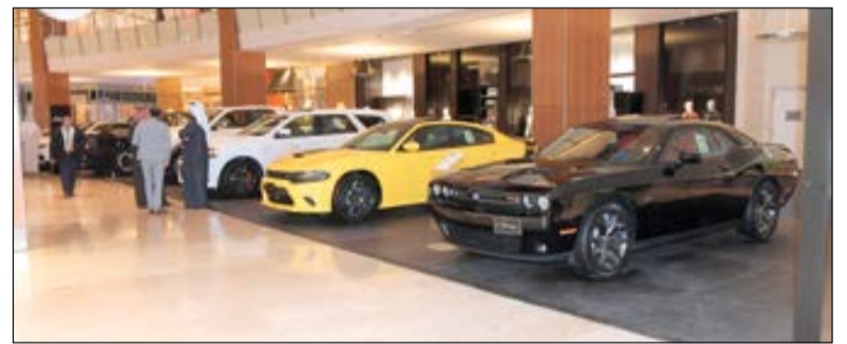
شركة الملا وبههاني للسيارات - دودج