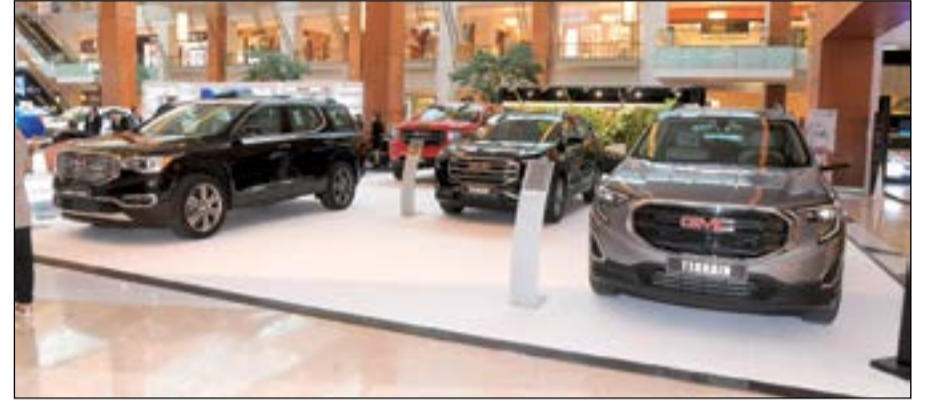
شركة محمد صالح ورضا يوسف ببهاني - جي ام سي