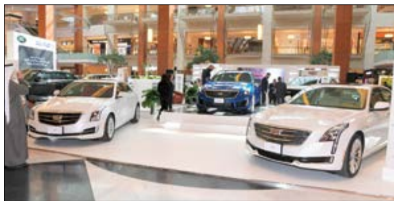
شركة يوسف أحمد الغانم - كاديلاك