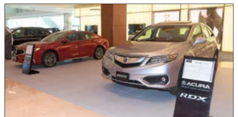
الملا أوتو - اكورا