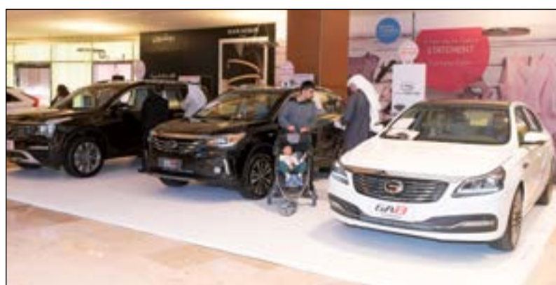
شركة المطوع والفاصي - جي ايه سي