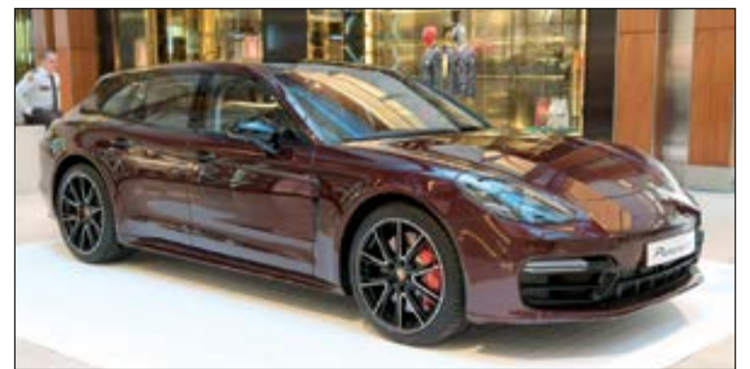
شركة بههاني للسيارات - مركز بورشه الكويت