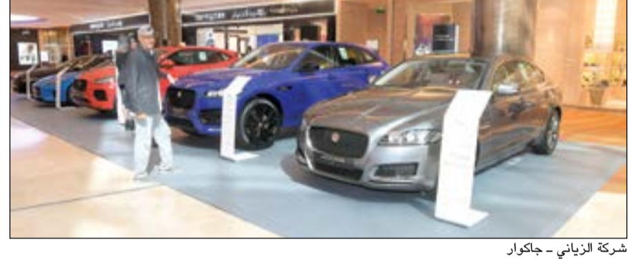
شركة الزباني - جاكوار

ويستمر إلى 20 الجاري في المنطقة الخارجية من المول. كما يشارك فريق كويت رايدرز للدراجات النارية بفعاليته السنوية كرنغال كويت رايدرز الثامن للدراجات النارية للعام 2018 في المنطقة الخارجية من مول 360 من الأربعة 24 يناير إلى الجمعة 27 الجاري. ويستقطب البايك شو الشباب المهتم بالدراجات النارية وعائلاتهم من الكويت والخليج والوطن العربي كافة للمشاركة بالفعاليات الممتعة. كما يفتح باب التسجيل لمنافسات البايك شو في 24 الجاري في مول 360 للراغبين في دخول المنافسات المعتمدة بلجنة تحكيم مختصة أوروبية على فئات مختلفة من الدراجات النارية.