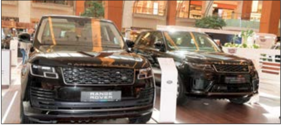
شركة علي الغانم وأولاده للسيارات - رينج روفر