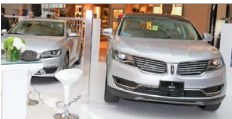
الغانم أوتو - لينكون