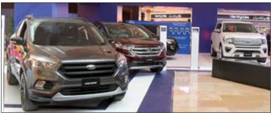
الغانم أوتو - فورد