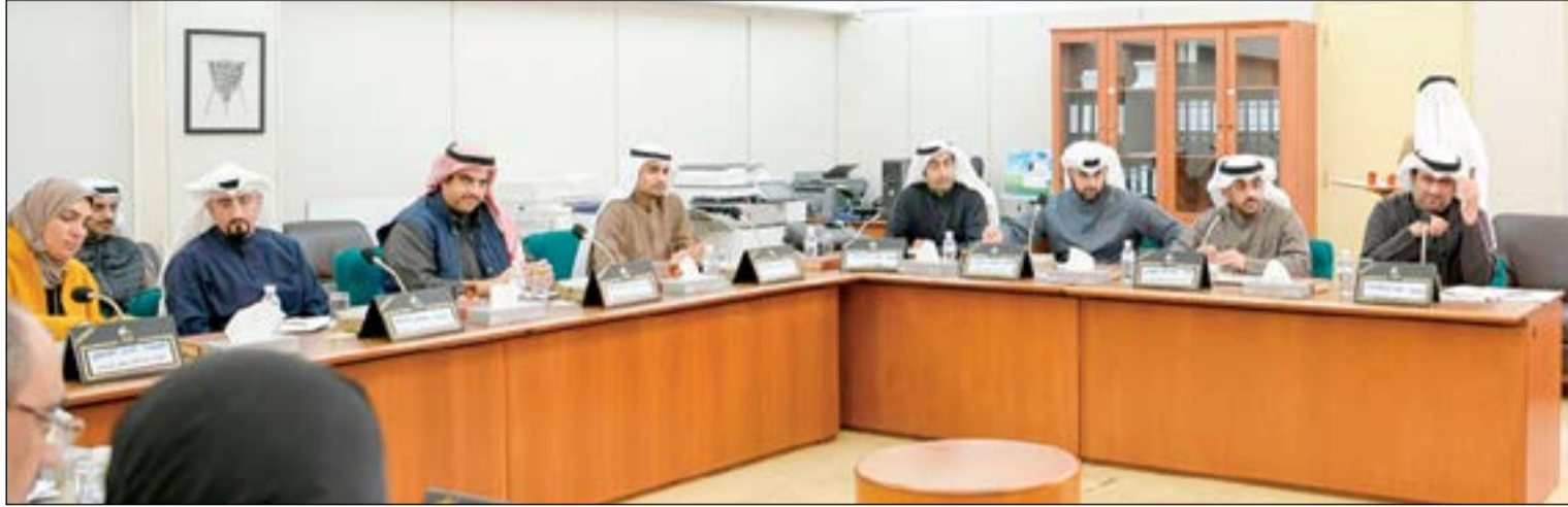
خالد الروضان وأركان وزارته أثناء اجتماع اللجنة

ليكون أكثر مرونة في تمويل مشاريع الشباب الكويتي