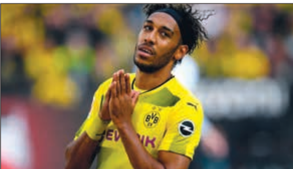
الغابوني بيار إيميريك أوباماينغ

كشفت صحيفة «بيلد» الألمانية ان مهاجم بوروسيا دورتموند الغابوني بيار إيميريك أوباماينغ في طريقه للانتقال الى صفوف أرسنال الإنجليزي في الأيام القليلة المقبلة. وقالت الصحيفة ان أرسنال يسعى الى الحصول على خدمات أوباماينغ خلال فترة الانتقالات الشتوية الحالية وقد بنجز كل تفاصيل العقد «في الأيام القليلة المقبلة». ويوجد والد اللاعب ووكيله بيار أوباماينغ في لندن لإجراء محادثات مع نادي العاصمة الإنجليزية الذي يحتل المركز السادس في الدوري المحلي. وخرج التونسي مالك الجزيري من الدور الثاني بخسارته أمام اللوكسمبورغي جيل مولر الثالث والعشرين 5-7 و6-4 و6-7 (5-7) و3-6 و2-6.