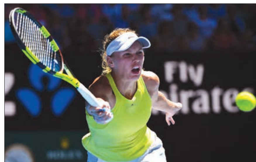
الدنماركية كارولين فوزنياكي وفوز بشق النافس

بلغت الدنماركية كارولين فوزنياكي والأوكرانية ايلينا سفيتولينا المصنفتان ثالثة ورابعة على التوالي والمرشحتان للقب، بشق النفس الدور الثالث من بطولة استراليا المفتوحة للتنس، أولى البطولات الأربع الكبرى، فيما لم يجد الإسباني رافايل نادال الأول اي غناء أمس لتخطي الدور الثاني. وفازت فوزنياكي على الكرواتية يانا فيت 3-6 و6-2 و7-5، وسفيتولينا على التشيكية كاترينا سنيكوفا 4-6 و6-2 و6-1، بعدما قلبتا خسارتهما المجموعه الأولى، فيما تغلب نادال على الأرجنتيني لياندرو مايل الـ 52 عالميا 3-6 و4-6 و7-6 (4-7). وتلتقي فوزنياكي في الدور المقبل مع الهولندية كيكى برتنز الثلاثين والتي تغلبت على الأميركية نيكول غيبس 6-7 (3-7) و6-0، من جهتها، تخوض سفيتولينا البطولة الكبرى الأولى هذا الموسم بمعنويات عالية بعد فوزها بدورة بريزبين الأسترالية الاعدادية ملبورن وتتويجها بخمسة القاب لعام الماضي، أكثر من أي لاعبة أخرى. وتضع سفيتولينا نصب عينها الفوز بأول لقب كبير في مسيرتها الاحترافية. الدور المقبل مع مواطنها الواعدة مرتا كوستيوك (15 عاما) التي تغلبت على الأسترالية أوليفيا روغوفسكا المشاركة ببطاقة