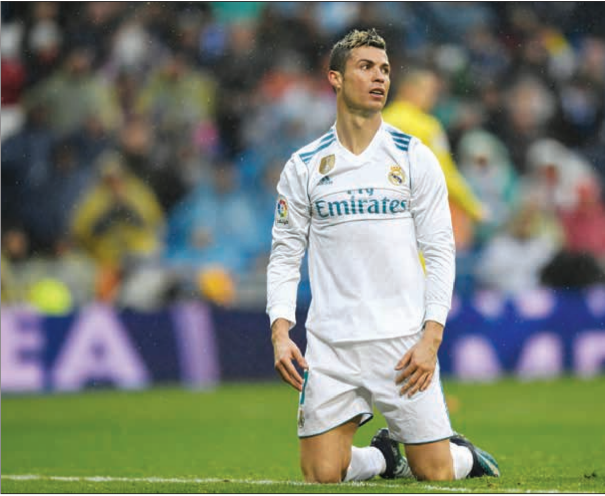
أفضل لاعب في العالم كريستيانو رونالدو مطالب بعونه للتألق من جديد

بنزيمة العائد من إصابة بفخذه حرمته من خوض المباريات حتى الآن في 2018، فيما ذكر نادي العاصمة ان قائد دفاعه سيرخيو راموس يتابع عملية تعافيه «بخوضه التمارين مع وبدون الكرة». فرنسا أفلت موناكو حامل اللقب من الخسارة أمام جاره وضيفه نيس وحظف هدف التعادل 2-2 في الوقت بدل الضائع، لكنه تنازل عن المركز الثاني