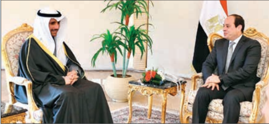
الرئيس المصري عبدالفتاح السيسي خلال استقباله رئيس مجلس الأمة مرزوق الغانم

على تعزيز التعاون مع مصر على كل المستويات، والتشاور والتنسيق معها بشكل مستمر مع مختلف العلاقات القضايا. وقال راضي ان الغانم ثمن دور مصر المحوري بالمنطقة باعتبارها ركيزة أساسية لأمن واستقرار الوطن العربي، مشيدا بحرص مصر على تعزيز التضامن بين الدول العربية والدفع قدما بالعمل العربي المشترك. ونكر المتحدث الرسمي باسم الرئاسة المصرية أن اللقاء شهد تباحثا حول مختلف جوانب العلاقات الثنائية، فضلا عن التشاور إزاء المستجدات على الساحة الإقليمية في ضوء التحديات القائمة حيث أكد الرئيس السيسي ارتباط أمن الخليج بالأمن القومي المصري، مشيدا بالدور النشط الذي تقوم به الكويت وقادتها على صعيد لم الشمل العربي وتوحيد الصف في مواجهة التحديات الكبيرة التي تواجه الأمة العربية في الوقت الراهن. حضر اللقاء رئيس مجلس النواب المصري د.علي عبدالعال وسفيرنا لدى القاهرة محمد الذويخ.