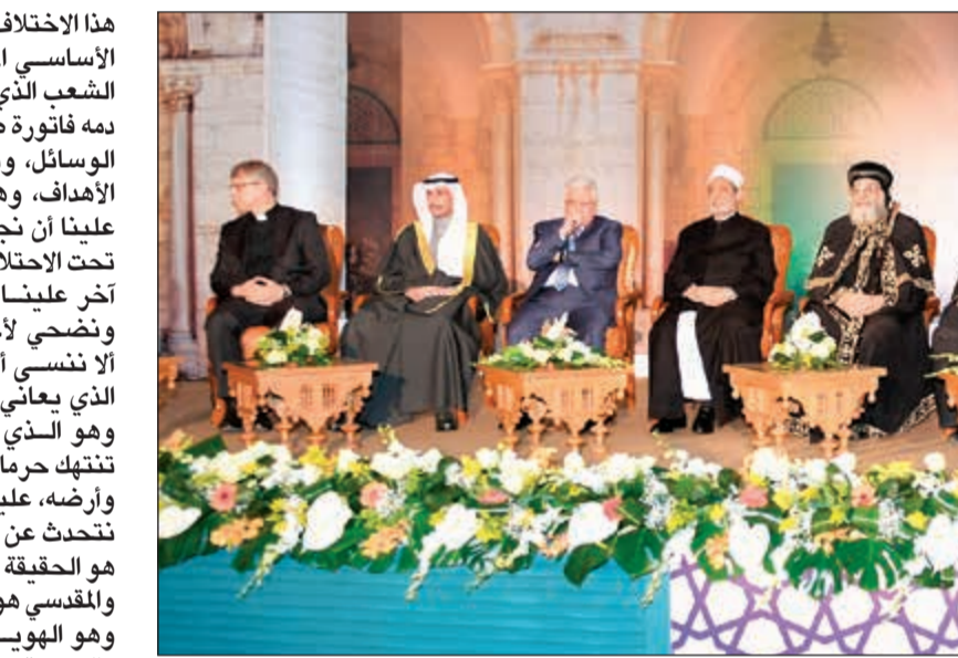
جانب من الجلسة الافتتاحية لمؤتمر الأزهر العالمي لنصرة القدس

تاريخية ودينية، بل لأنها قضية أصبحت وستبقى، مغروسة عميقا جدا في وجداننا الجمعي، هي قضية العاطفة التي لا تقبل بالحل الوسط سياسيا، هي قضية الذنب والإثم الذي لا يحق مهمما تطور وتقدم، ستبقى قضية الشاهد والحيث الذي الأخلاقي وبيدائيته وتخلفه، فشكرا كبيرا للأزهر على هذه الفعالية التي جاءت في وقتها، فالأزهر مهما قيل فيه، سيبقى حاملا لتلك الرمزية الدالة على دوره التاريخي الكبير في نصرته وحياتها؟ حضورنا الكرام ... يتحدث عنوان هذا المؤتمر عن «نصرة القدس»، وأول سؤال ربما يتبادر إلى الذهن هنا «كيف ننصر» القدس؟ وأين تكمن مفاهيم «النصرة» وتطبيقاتها؟ وهنا سنتخلف، وهذا أمر لا يقلقني حتى أكون صريحا معكم، فإني قد دعوت إلى النصر بالسلام، وفريق يدعو إلى العصيان المدني، وفريق يدعو إلى المقاطعة والضغط الديبلوماسي، وفريق يدعو إلى التجنيس، وفريق يدعو إلى الانتفاضة المسلحة، وفريق يدعو إلى عدم الخوض في المغامرات غير المحسوبة، وفريق يدعو إلى الذهاب إلى رعاية السلام والدول العظمى لأن بيدها خيوط اللعبة، وسنختلف ونختلف، وسيزايد هذا، ويكابر ذلك، ثم ماذا؟ نحن ننسى في خضم كل