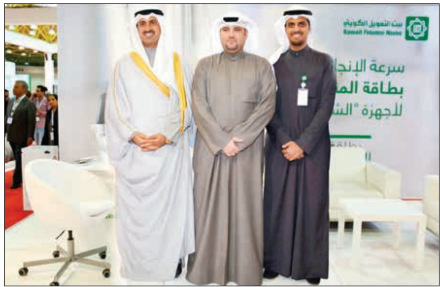
الشيخ نمر الصباح في جناح «بيتك»

وتوفر المشاركة في المعرض فرصة اللقاء المباشر مع العملاء والرد على استفساراتهم، وتعزيز أساليب التواصل معهم ضمن خطة تسويقية شاملة تستهدف الوصول إلى شرائحهم المختلفة في أماكن وجودهم وتقديم معلومات ورؤية شاملة عن «بيتك» ودوره المهم في صناعة التمويل الإسلامي، مع تعزيز الانتشار والتواجد، والتعرف على المتطلبات والاحتياجات التي يطرحها العملاء ودراسة آرائهم ومقترحاتهم والعمل على توفيرها وتطبيقها للوصول إلى أعلى المعايير في خدمة العميل. ويتميز المعرض هذا العام بكمية المشاركين الكبيرة إذ بلغ عدد الشركات والجهات المشاركة نحو 900 شركة من مختلف دول العالم.