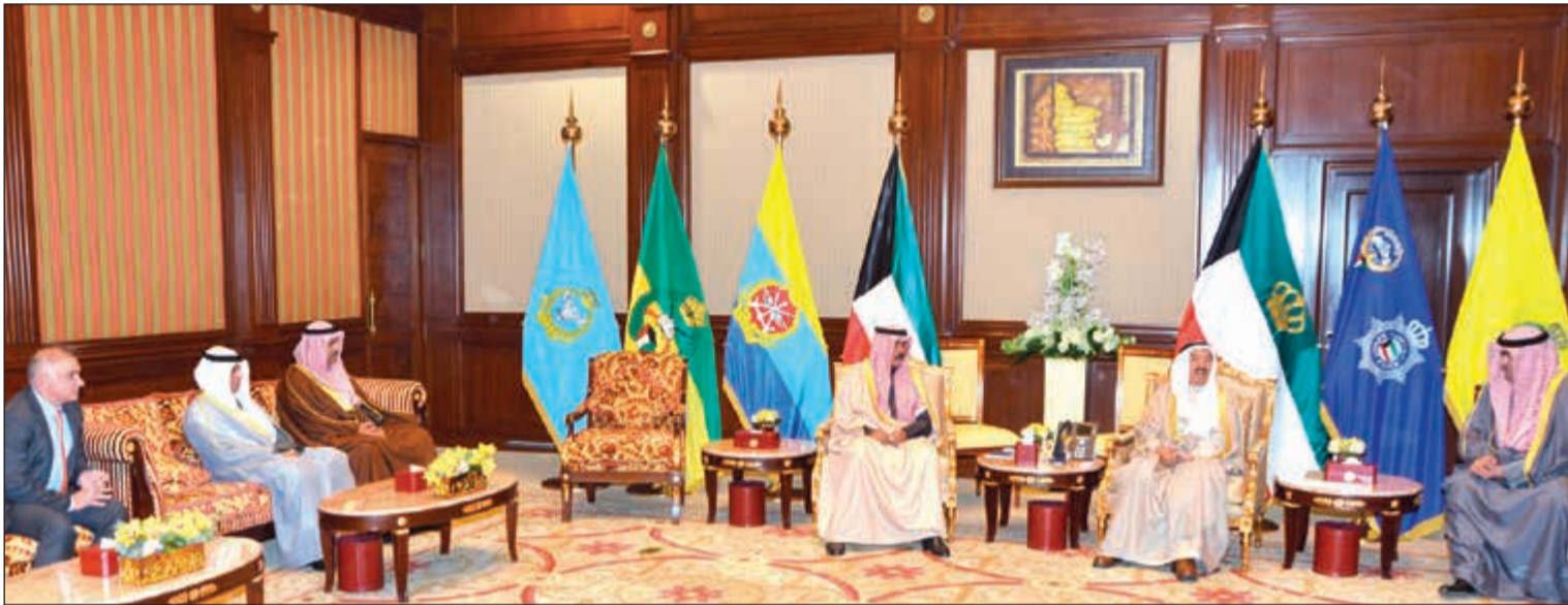
صاحب السمو مستقبلا خالد الروضان والمعينين الجدد في «التجارة» و«الصناعة»، وهيئة الرياضة بحضور سمو ولي العهد الشيخ نواف الأحمد