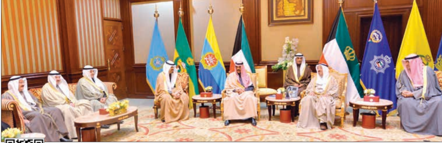
صاحب السمو الأمير الشيخ صباح الأحمد وبحضور سمو ولي العهد الشيخ نواف الأحمد مستقبلا خالد الروضان ومدير عام هيئة تشجيع الاستثمار المباشر الشيخ د.مشعل الجابر

قال نائب وزير الخارجية خالد الجارالله ان الكويت ستستضيف في 13 فبراير المقبل فعاليات الاجتماع الوزاري للتحالف الدولي ضد ما يسمى بتنظيم الدولة الاسلامية (داعش) والذي يضم 74 عضوا من الدول والمنظمات الدولية. وأضاف الجارالله في رد على سؤال لوكالة الأنباء الكويتية (كونا) ان الاجتماع يأتي في إطار استمرار الجهود الدولية والتنسيق المشترك في مجال مكافحة الارهاب ومتابعة الاستراتيجية التي رسمها التحالف لمحاربة هذا التنظيم. وأشاد بما حققه التحالف من خطوات كبيرة وملموسة في العراق وسورية معربا عن التطلع للمزيد من تضافر الجهود والعمل المشترك بين الاعضاء بما يسهم في تحقيق الاستقرار للمجتمع الدولي الذي تضرر من هذا التنظيم.