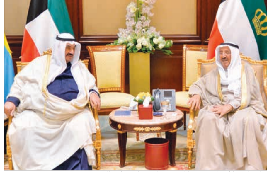
صاحب السمو الأمير الشيخ صباح الأحمد مستقبلا سمو الشيخ ناصر المحمد

يمكن استخدام QR كود أو لمشاهدة الفيديو يتمتع استخدام QR كود أو