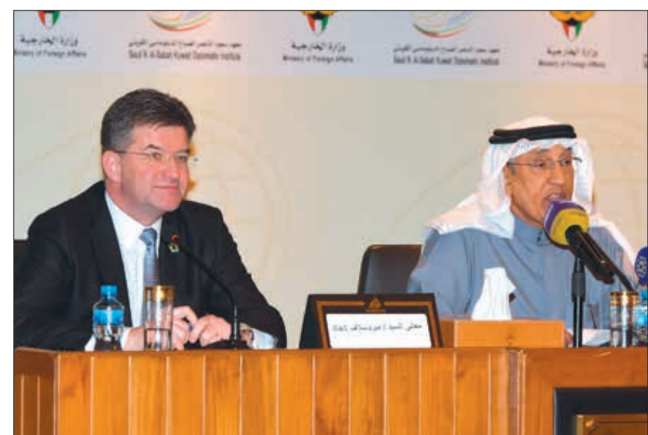
رئيس الجمعية العامة للأمم المتحدة ميروسلاف لايتشاك والسفير عبدالعزيز الشارخ خلال المحاضرة

دعم قطاع الماء من أجل التنمية الدائمة، بالإضافة الى تنظيم حدث رئيسي للشباب في مايو واطلاعهم على دور الأمم المتحدة تجاه الجيل الجديد، والحدث الأهم في شهر يونيو يتناول موضوع تمويل برامج التنمية المستدامة، مضيفا ان من أهم أولوياتنا هي عملية درء أي صراع وحماية السلم العالمي، إضافة الى أولوية إعادة التشكيل لأن العالم يتغير ويجب ان نتغير معه، لذا سنبداً بعمليتين في هذا الصدد، الأولى عملية إحداث التغيير في الأمم المتحدة، والعملية الثانية هي إعادة تأهيل وتشكيل الجمعية. وأضاف لايتشاك، ان أهداف الدورة الـ 72 للجمعية تتضمن 3 اقتراحات تغيرية تشمل قطاع الإدارة وقطاع التمويل